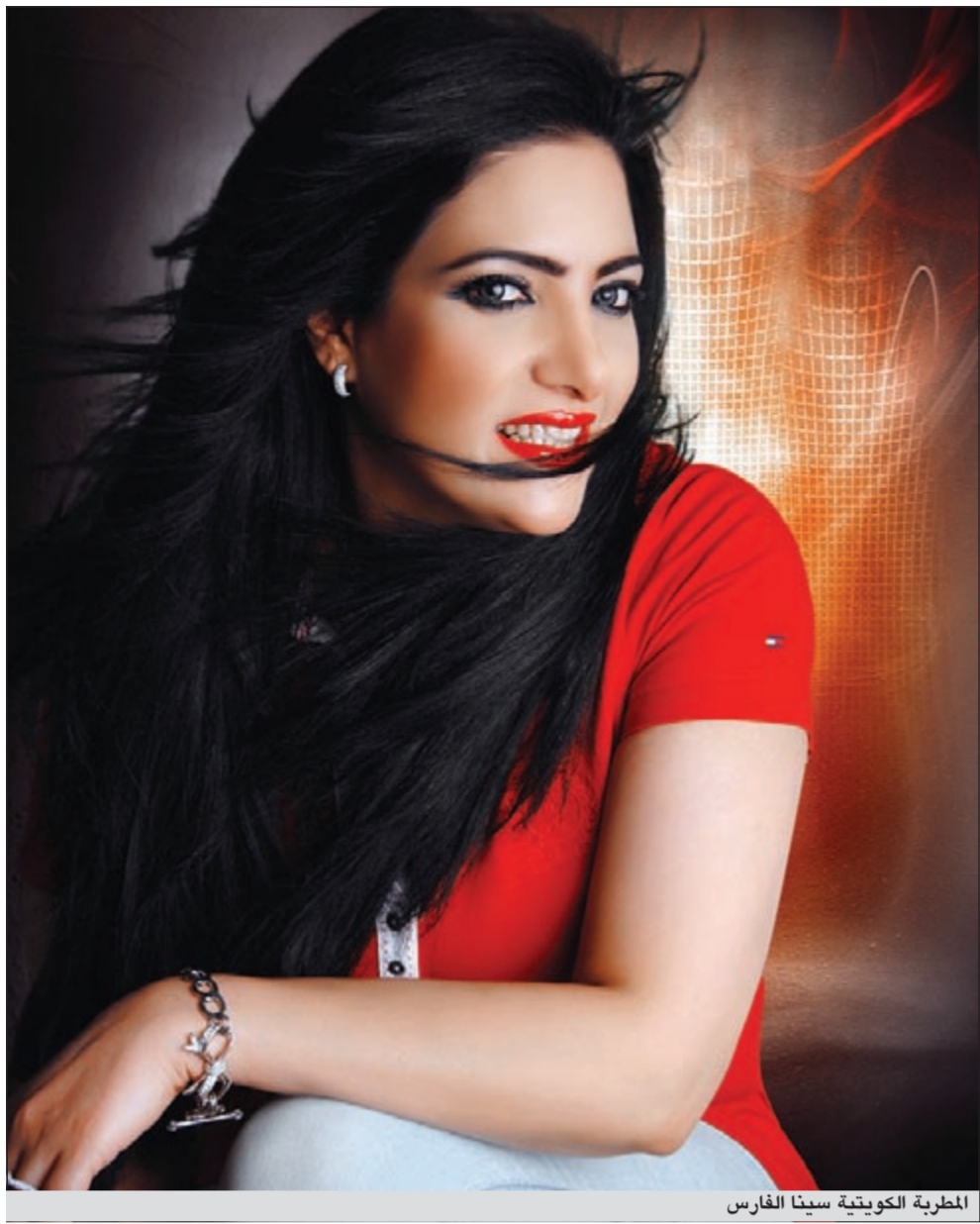
المطربة الكويتية سينا الفارس