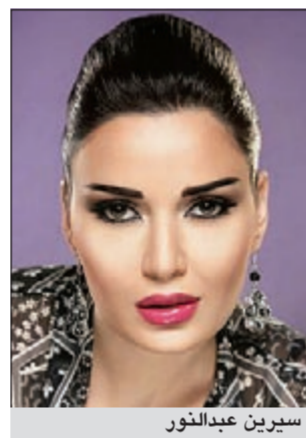
سيرين عبد النور

نجحت سيرين عبد النور في كسب أول رهان لها، ونالت لقب أفضل ممثلة عربية لعام 2012 في تصويت «سما النجوم» على «فيسبوك». ورغم التنافس الشديد بين سيرين وسلافة معمار في المرحلة الأولى من التصويت، إلا أن المرحلة الثانية شهدت تفوقا كبيرا لصالح الفنانة اللبنانية مع تقدم سريع لغادة عبد الرزاق، واقتحام جومانة مراد لائحة الخمسة الأول رغم عدم مشاركتها في أي عمل. وجرى الاستفتاء، بحسب