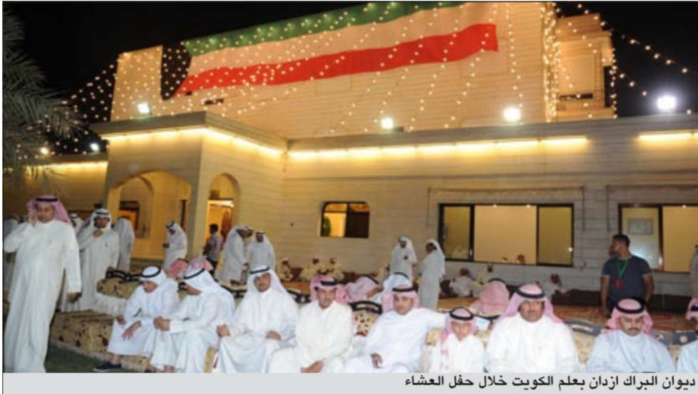
ديوان البراك أزدان بعلم الكويت خلال حفل العشاء

واضاه: متى ما شفقتوا اني اهتف بسقوط ملك الاردن اعرفوا اني تثبت من المعلومة والى الشباب الكويتي المشارك بالمسيرة لو يضرركم سفه من القوات الخاصة تحملا هذا