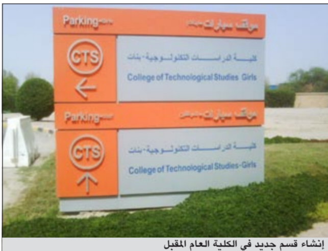
إنشاء قسم جديد في الكلية العام المقبل

قبل اعتماده، واوضحت المصادر انه ينبغي استقراء حاجة السوق التي اشتدتها للموافقة عليه انتهاء اللجان التحضيرية للمشروع من بقية المهام والأعمال المطلوب إنجازها للحصول على الموافقة النهائية. يذكر انه تم تشكيل لجنين الأولى تهتم بتحديد المواد والمقررات الدراسية لبلدوم الهندسة المعمارية بما يتوافق ويتماشى مع جميع الجامعات العالمية التي تقدم هذا البرنامج الدراسي، واللجنة الأخرى تعمل على استقراء حاجة سوق العمل في القطاع العام والخاص. ● ناصر السليم