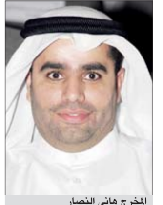
المخرج هاني النصار