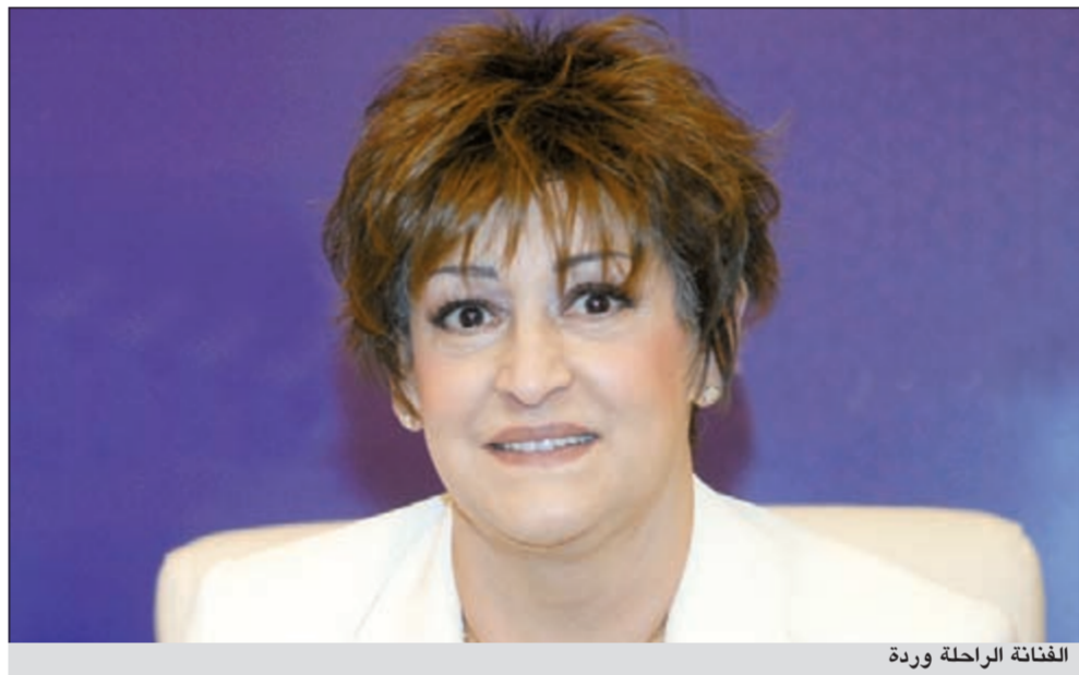
الفنانة الراحلة وردة

إن «كتكتت قال له إنه لا يفكر في إنتاج أي من السير الذاتية، بسبب مشاكلها الجمة». وبسؤاله عما سيحدث مع المسلسل الذي سيتناول قصة حياة الموسيقار الكبير بليغ حمدي المتزوج من وردة، قال وجدي: «هذا العمل يتناول حياة بليغ وإذا تناول وردة فسيتكون التناول عرضياً دون التطرق للتفاصيل، وسيقال فقط إنها كانت زوجة بليغ وهذه حقيقة يعلمها الجميع، أضف إلى ذلك أن المسلسل به العديد من الشخصيات الفنية، مثل ليلي مراد وأم كلثوم وفايزة أحمد ومحمد رشدي وعبدالحليم حافظ ومحمد فؤاد ومحمد فوزي وآخرين كانوا في عصر بليغ، أي أن شخصية وردة ستكون مثلها مثل هذه الشخصيات الأخرى تأتي بشكل عرضي».