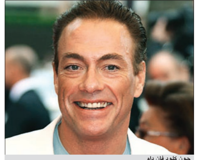
جون كلود فان دام

وكالات: أكدت بعض المصادر الإعلامية أن الممثل العالمي جون كلود فان دام سيزور إمارة دبي، للتواصل مع جمهوره وإجراء لقاءات تلفزيونية، يتحدث فيها عن جولته العالمية ومشروعاته الجديدة في مجال السينما والرياضة. يذكر أن بلجيكا كانت قد قدمت لمواطنها تمثالاً له بالحجم الطبيعي مصنوعاً من البرونز، وذلك منتصف أحد أشهر ميادينها بمدينة اندرلخت، تكريماً لما حققه من إنجازات رياضية وفنية على مدار سنوات حياته المهنية.