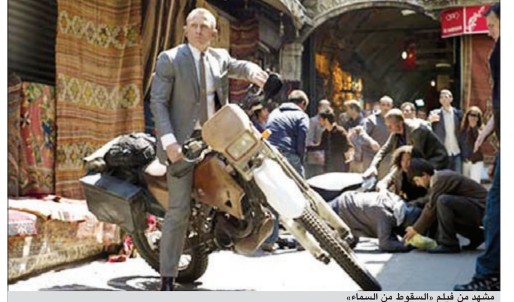
مشهد من فيلم «السقوط من السماء»

لندن - رويترز: قال منتجو فيلم جيمس بوند الجديد «السقوط من السماء» أنه ضرب رقماً قياسياً جديداً في الإيرادات التي حققها في عطلة الأسبوع في بريطانيا متفوقاً على كل أفلام المخبر السري البريطاني الشهير. وحقق الفيلم وهو الثالث والعشرون في سلسلة أفلام بوند العميل رقم 007 ما وصل إلى 20.1 مليون جنيه إسترليني (32.36 مليون دولار) بعد افتتاحه يوم الجمعة الماضي في 587 داراً للسينما في المملكة المتحدة وإيرلندا. وقال منتج الفيلم مايكل جيه ويلسون وباربرا بروكولي في بيان «نشعر بسعادة غامرة للاستقبال الذي حظي به فيلم السقوط من السماء في عطلة الأسبوع هذه. هذا مؤشر على وجه خاص لأن المملكة المتحدة هي موطن جيمس بوند، كما حلت هذا العام الذكري السنوية الـ 50 لأفلامه». وحضر الأمير تشارلز ابن الملكة إليزابيث