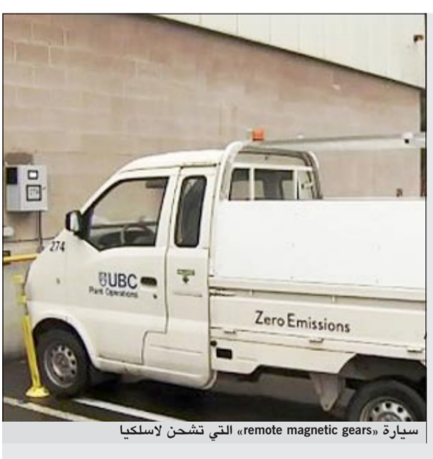
سيارة «remote magnetic gears» التي تشحن لاسلكيا

بقي ان نقول ان العروس التي تدعى ليو شنج وهي من مدينة جوانزهو التابعة لإقليم فوجان في جنوب الصين تستغرق في لبس هذه الكمية من الذهب ساعة كاملة وبمساعدة والدتها التي تلبسها القطع والمجوهرات.