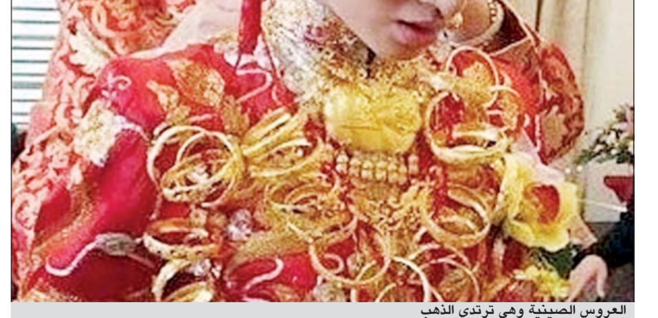
العروس الصينية وهي ترتدي الذهب

وكالات: هذه العروس الصينية السعيدة تلبس ذهباً بقيمة نصف مليون دولار تقريبا، طبعا الذهب ليس على حساب العريس وإنما على حساب الأهل الذين جمعوا هذه القطع الذهبية على مدار السنوات حتى تلبسها ابنتهم الوحيدة يوم عرسها وذلك من أجل رفع قيمة