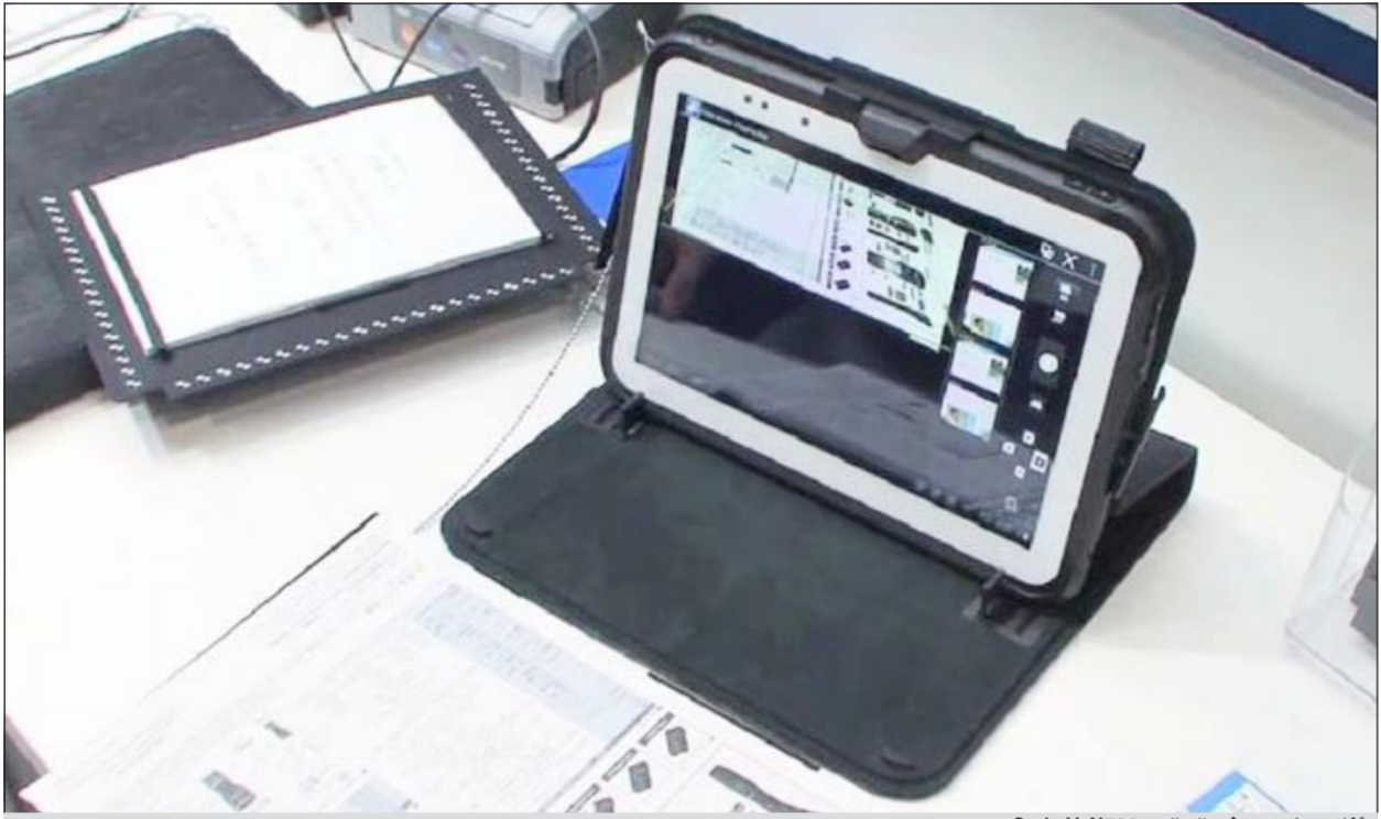
أعلى حاسوب في العالم «Casio V-N500»

بسرعة 1,5 غيغاهيرتز، وذاكرة «رام» سعة واحد غيغابايت، وذاكرة داخلية سعة 16 غيغابايت، قابلة للزيادة عبر منفذ «مايكرو إس دي».