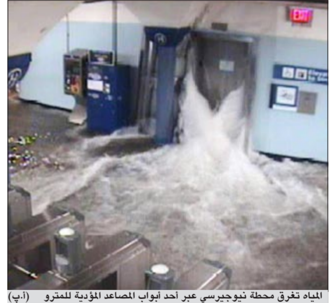
المياه تفرق محطة نيو جيرسي عبر أحد أبواب المصاعد المؤدية للمетро