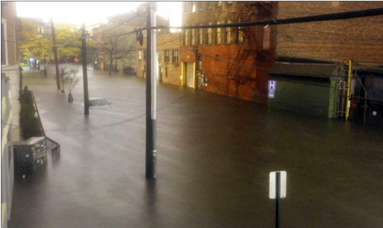
الفيضانات كادت بما في أحد شوارع هوبكن بنيو جيرسي