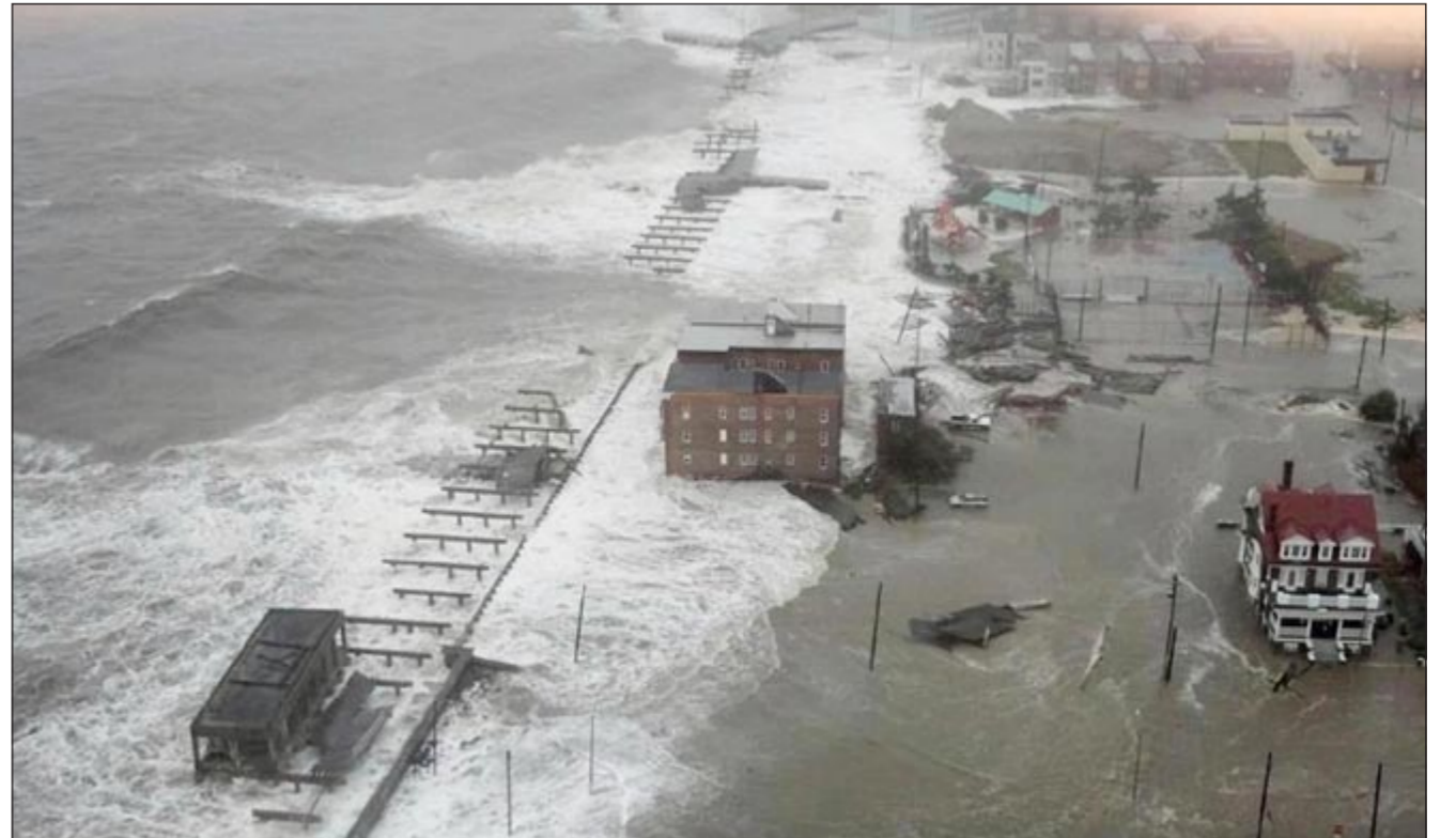
مدينة أتلانتا في نيو جيرسي اكتسحت مياه البحر شواطئها لأكثر من 500 متر إلى الداخل وأدت إلى غرق عشرات البيوت المطلة على البحر