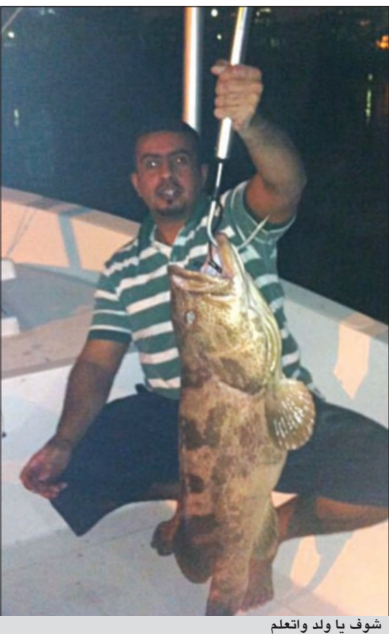
شوف يا ولد واتعلم