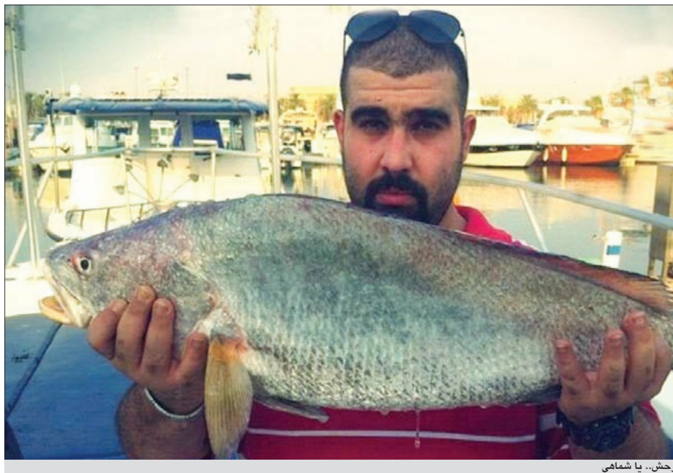
وحش.. يا شاماي