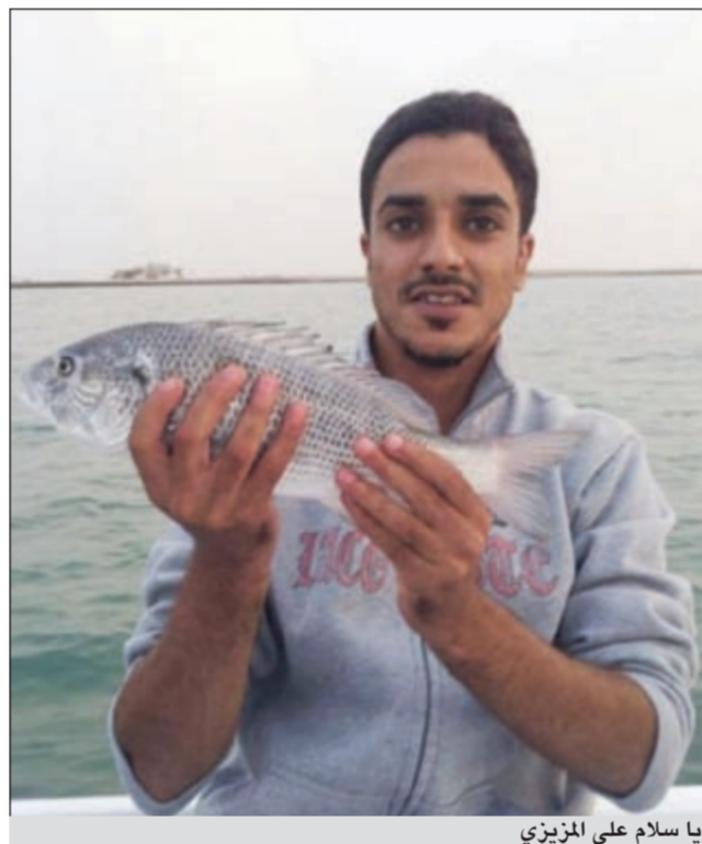
يا سلام على المزيبي

● لا أكتب لهم سوى بعض النصائح ومنها المحافظة على ما تبقى من بحرنا والاهتمام بعبء السلامة والإسعافات الأولية كاملة وأكتب الى مدمري بحرنا وأقول لهم يكفي ما تفعلونه باسماننا وبحرنا من دمار، كما أتمنى من المسؤولين على المسنات الاهتمام وصيانة وإنشاء مسنات جديدة لأن الكيل طلع بنا، ومع الأسف لا يوجد من يسمع نداءنا. وفي الختام أدعو للمجيم بالصيد الوفير.