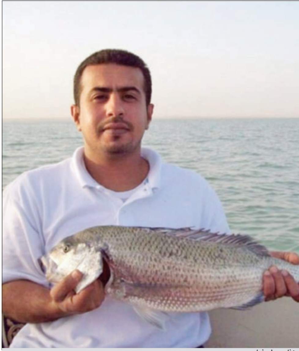
وهذا سببى غرامى