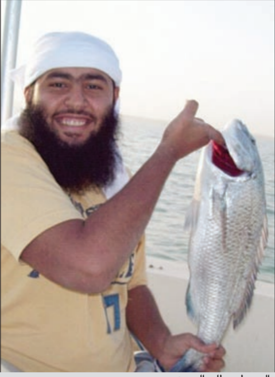
السببى مطلب الجميع