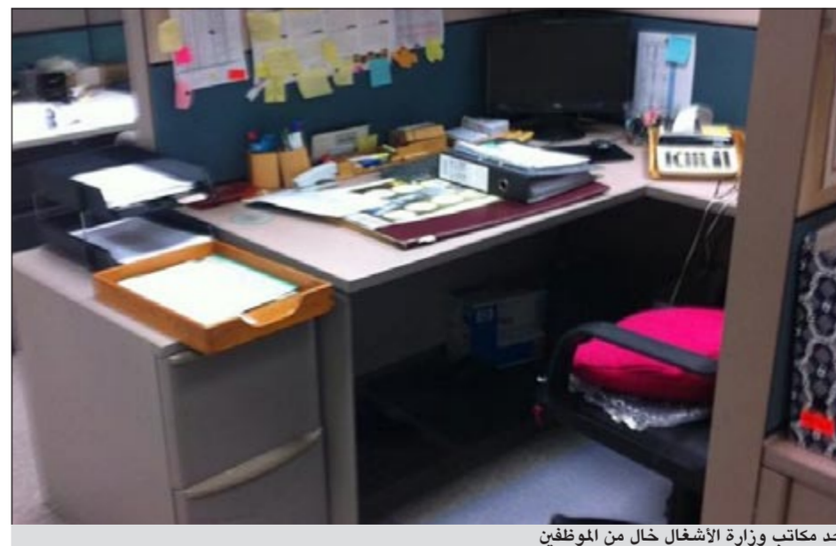
أحد مكاتب وزارة الأشغال خال من الموظفين

لم تختلف وزارة الأشغال كثيرا عن بقية الوزارات، حيث نالها نصيب كبير من غياب الموظفين. فقد كانت نسبة الغياب تشير إلى أكثر من 30%، حيث كانت المكاتب خالية. وعلل بعض الموظفين المتواجدين بأن غياب زملائهم يعود إلى كونهم يتمتعون بإجازات للحج وإجازات مرضية، ولكن الواقع غير ذلك، حيث ان التستر من قبل المسؤولين كان سبب الغياب.