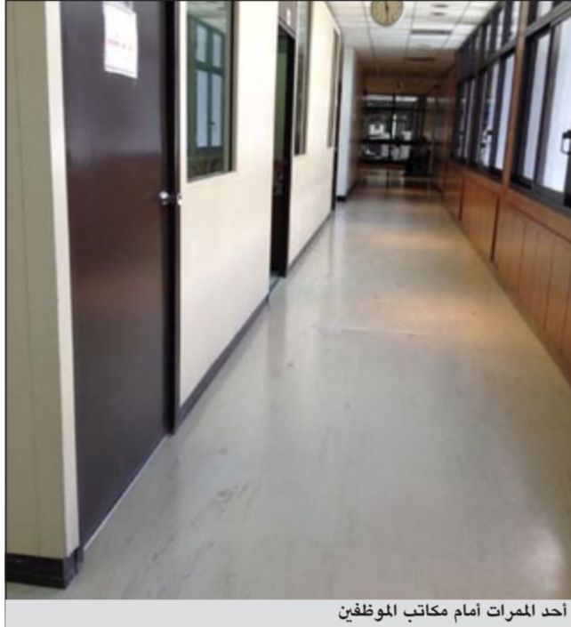
أحد الممرات أمام مكاتب الموظفين