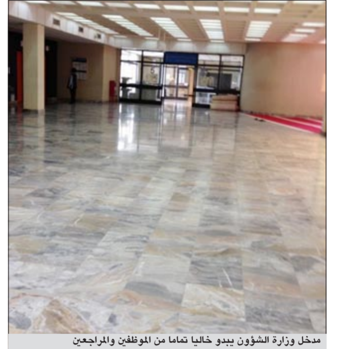
مدخل وزارة الشؤون يبدو خاليا تماما من الموظفين والمراجعين

حج، لافتين إلى أن الغياب نسبة كبيرة منه مبررة، أما الغياب غير المبرر فسيتم التعامل معه وفق الأطر القانونية.