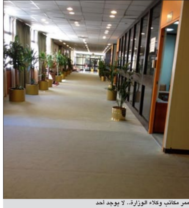
ممر مكاتب وكلاء الوزارة.. لا يوجد أحد