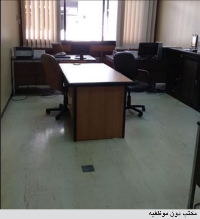
مكتب دون موظفيه