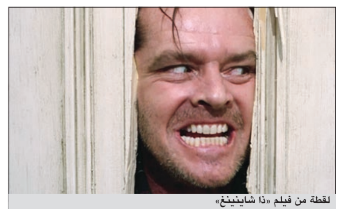
لقطة من فيلم «ذا شايينغ»

لندن - يو.بي.أي: نكرت دراسة بريطانية أن مشاهدة فيلم رعب تغنيك عن نصف ساعة من المشي من حيث حرق السعرات الحرارية. ونقلت صحيفة «ديلي ميل» البريطانية عن باحثين في جامعة لندن - يو.بي.أي: نكرت دراسة إن الدراسة أظهرت أن المشاهدين أحرقوا خلال فيلم رعب يستغرق ساعة ونصف الساعة 113 سعرة حرارية وهي توازي السعرات الحرارية التي يحرقونها خلال نصف ساعة من المشي. وقام الباحثون بتتبعه الأشخاص خلال مشاهدتهم لأحد أفلام الرعب بهدف مراقبة معدل نبضات القلب وكميات الأكسجين وثاني أكسيد الكربون المستهلكة بهدف استنتاج معدلات الطاقة