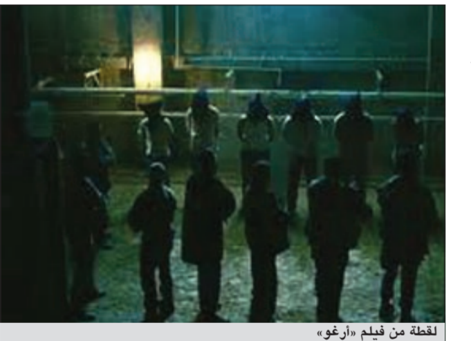
لقطة من فيلم «أرغو»

وقد حقق هذا الفيلم الكوميدي 4,1 مليون دولار من العائدات.