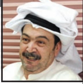
www.salahsayer.com سعد المعطش

التعلم هو الشيء الذي لا يتوقف عند عمر محدد ولا يقتصر على جنس دون جنس آخر، ولا يمكن أن يكون التعلم من الأشياء الجيدة فقط لأننا سنتساها ولكن الأشياء السيئة سنتعلم منها حتى لا نقع بها كما وقع بها غيرنا، وقد قيل إن من لم يتعلم من أخطاء غيره فسوف يتعلم من أخطائه.