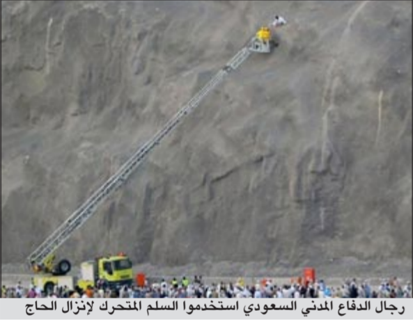
رجال الدفاع المدني السعودي استخدموا السلم المتحرك لإنزال الحاج

أنقذت فرق الدفاع المدني السعودي السبت حاجاً سقط من أحد المرتفعات، بينما كان يهيم لتسلق أحد الجبال المطلة على جسر الجمرات. الحاج كما يروي شهود العيان كان يتسلق أحد الجبال شديدة الوعورة، وانزلق بعد ان تقطعت به السبل الى منتصف الجبل. رجال الدفاع المدني المنتشرون في كل مكان حول منشأة جسر الجمرات رصدوا الحادث وتم تمرير البغال الى غرف عمليات الدفاع المدني، التي بدورها سارعت بإرسال معدات متخصصة وقريبة من المكان، وصعد رجال الدفاع المدني مستخدمين سلالم كهربائية متطورة، يساندتهم رجال الهلال الأحمر السعودي للمكان الذي تشبث الحاج به خوف السقوط أمام مرأى العديد من حجاج بيت الله الحرام الذين كانوا