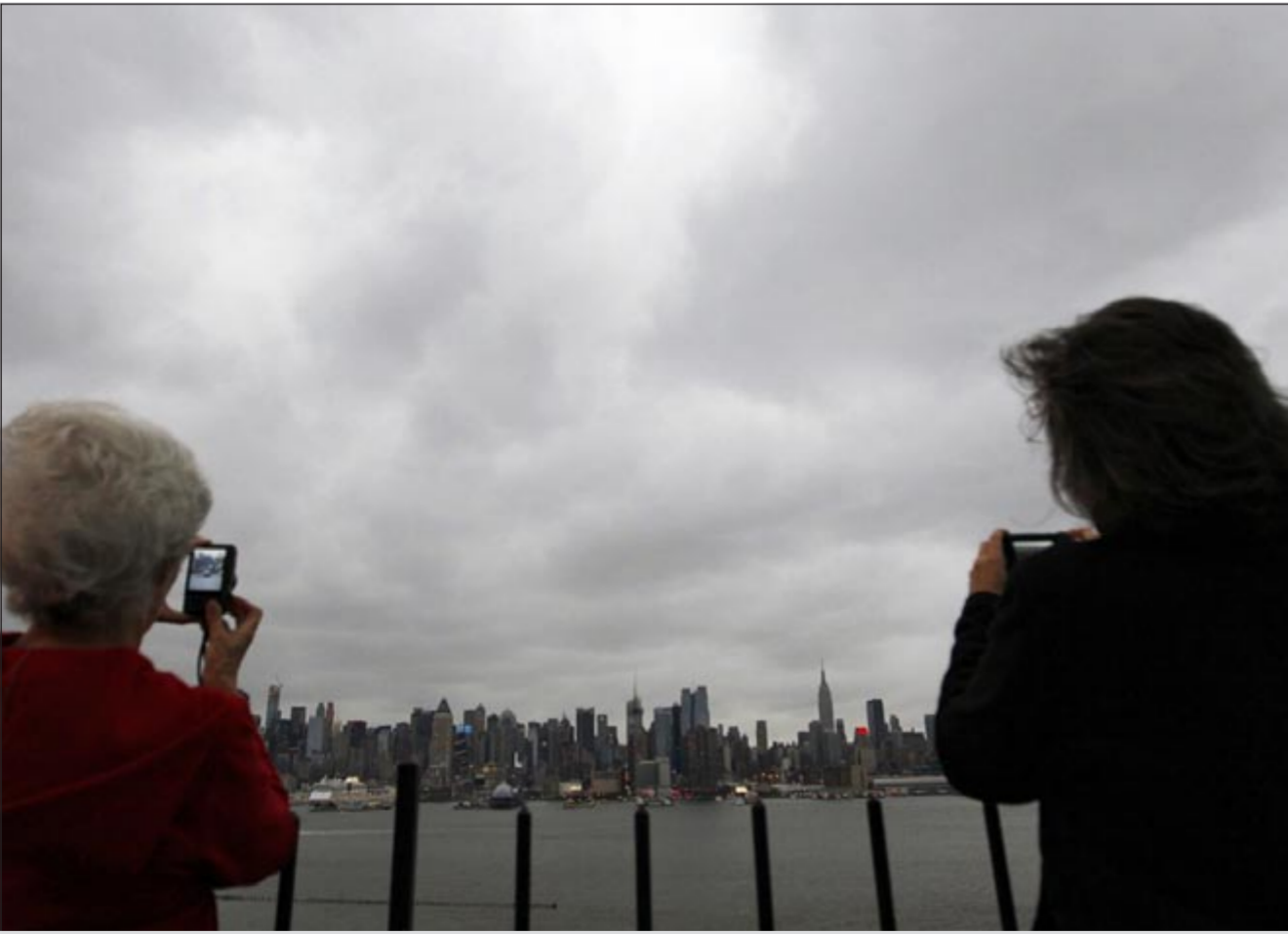
مواطنان أميركيان يلتقطان صوراً لاقتراب الغيوم السابقة لـ «ساندي»

القمار في اتلانتيك سيتي ابتداء من الاحد. وأطلق خبراء الطقس على هذه الظاهرة اسم «فرانكستورم» نسبة إلى شخصية الوحش فرانكشتاين المرعبة نظراً لتزامنها مع عيد جميع القديسين (الهالوين) في 31 أكتوبر، ولأنها مؤلفة من أجزاء مختلفة تماماً مثل فرانكشتاين. وأدى الإعصار ساندي الذي يتقدم من فوق المحيط الأطلسي إلى وفاة 66 شخصاً في منطقة الكاريبي معظمهم في هايتي حيث قتل 51 شخصاً.