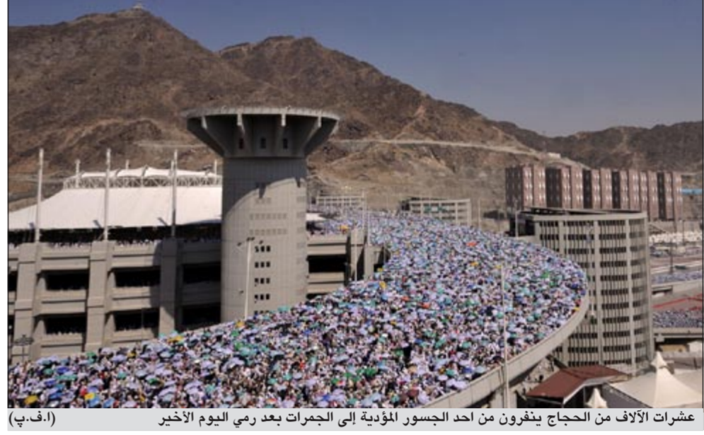
عشرات الآلاف من الحجاج ينفرون من أحد الجسور المؤدية إلى الجمرات بعد رمي اليوم الأخير (أ.ف.ب)

في جانب متصل، اعتمد مجمع الملك فهد لطباعة المصحف الشريف بالمدينة المنورة هذا العام توزيع أكثر من مليون و800 ألف نسخة من المصحف الشريف بإصدارات وتراجم وأحجام مختلفة. ويحمل عسيرة «هدية خادم الحرمين الشريفين الملك عبدالله بن عبدالعزيز إالى حجاج بيت الله الحرام»، لضيوف الرحمن بعد أدائهم نسكهم والمغادرين إلى بلادهم عبر مطار الأمير محمد بن عبدالعزيز الدولي بالمدينة المنورة ومطار الملك عبدالعزيز الدولي بجدة وعبء المنافذ البرية والبحرية. وصرح الأمين العام لمجمع الملك فهد لطباعة المصحف الشريف د.محمد سلال بن شديد العوفي أمس الأول بأن هذه الهدية المباركة هي أتمن وأفضل وأغلى ما يمكن تقديمه للحجاج لدى مغادرتهم الأراضي المقدسة عائداً إلى بلادهم، ويقوم بتوزيعها أكثر من 450 موظفاً موزعين عبر المنافذ.