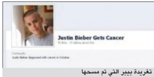
تغريدة بيبير التي تم مسحها

لم يتبين حتى الآن ما إذا كان خبر تشخيص مرض السرطان للفنان جاستن بيبير صحيحاً أم لا، لاسيما بعد أن نشر عبر مواقع التواصل الاجتماعي تغريدة باسم بيبير يعترف فيها بالإصابة، ولكن سرعان ما اختفت التغريدة لينطلق الخبر كالتار في الهاشم، وتنتقل حملة تضامنية مع بيبير قام بها معجبهوه الذين يتخطى عددهم المليون في العالم.