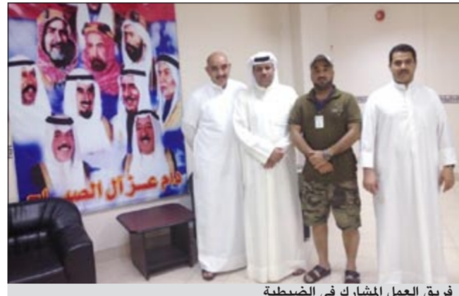
فريق العمل المشارك في الضبطية