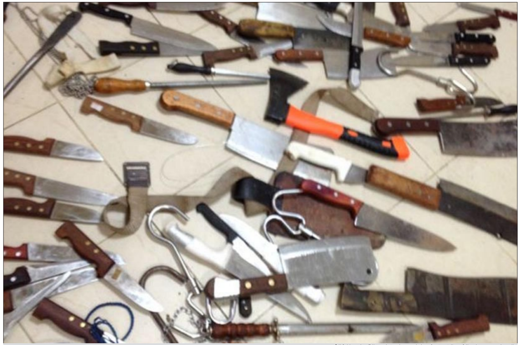
السكاكين ومعدات الذبح التي تم ضبطها ومصادرتها من القصابين المخالفين