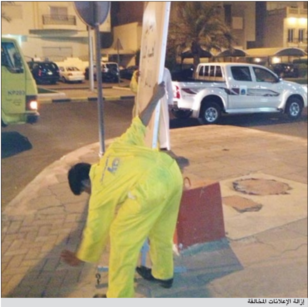
إزالة الإعلانات المخالفة

التزامها بقواعد النظافة العامة وإزالة 13 محصاراً للمواشي من منطقة الري فضلاً عن المناطق السكنية التي شملت مناطق الفيحاء، كيفان، الشامية، المنصورية والبرموك. وأشار الصواغ إلى أن البلدية تمنع عمليات الذبح العشوائي خارج المسالخ المعتمدة، حفاظاً على حياة المواطنين والمقيمين من تلوث الذبائح سواء من العامل غير المتخصص وما قد يحمله من أمراض، أو من أدوات الذبح غير المعقمة والرديئة، وكذلك المكان غير الصحي للذبح، فضلاً عن احتمال انتقال تلك الأمراض إلى الأضحية وما تشكله تلك الظاهرة غير الصحية من انعكاسات سلبية على الصحة العامة. وأضاف الصواغ أن فريق العمل تمكن من مصادرة 354 سي دي مدمجاً من الباعة المتجولين وإزالة 197 إعلان تهنئة بالعيد من عدد من المناطق بالعاصمة، مشيراً إلى أن جهود فريق الطوارئ متواصلة على قدم وساق بهدف التصدي للتجاوزات غير القانونية وكل ما يعرقل فرحة العيد تحقيقاً للمصلحة العامة.