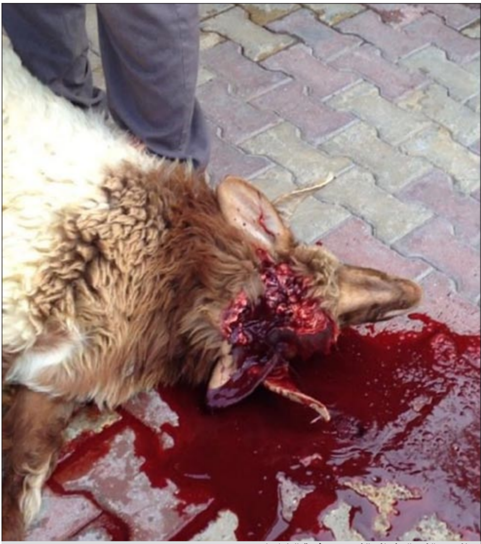
جانبا من الذبح العشوائي الذي رصده فريق الطوارئ