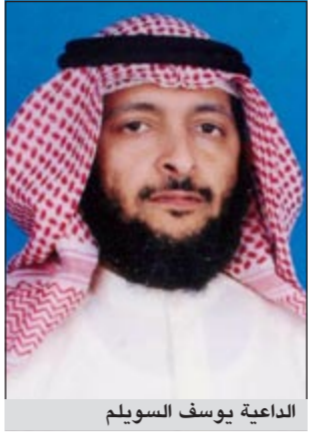
الداعية يوسف السويلم