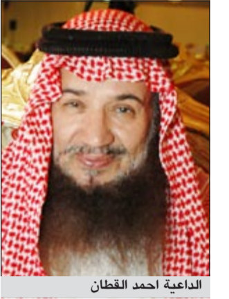
الداعية أحمد القطان