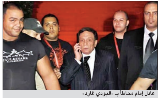
عادل إمام محاطا بـ «البودي غارد»

لا شك أن حضور النجم عادل إمام في أي مناسبة يضفي عليها نوعا خاصا