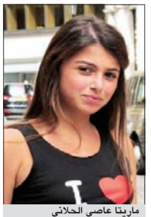
ماريّا عاصي الحلاني