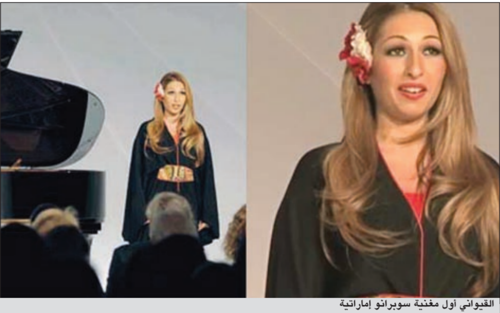
القيواني أول مغنية سوبرانو إماراتية