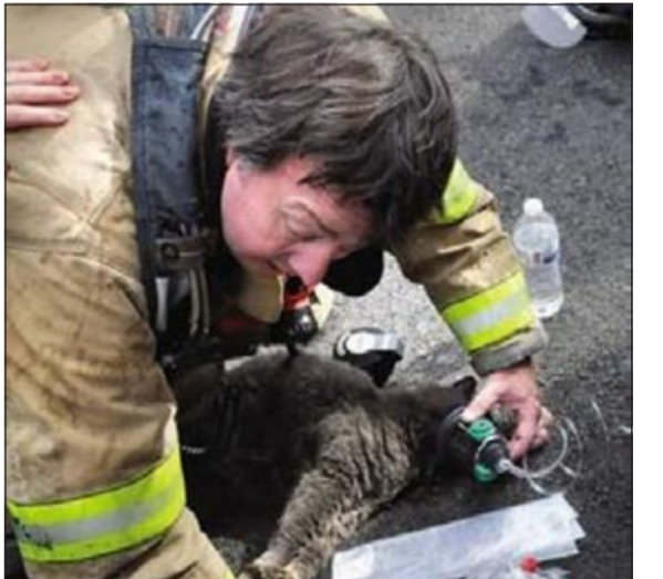
أحد الإطفائيين خلال انعاش القطة المسنة

لوس أنجليس - يو.بي.أي: كتبت لقطة في الـ 17 من العمر حياة جديدة بعدما تمكن إطفائيون من إنعاشها إثر اشتعال حريق هائل أتى على منزل تاريخي في بورتسموث باميركا. وأقام موقع «بيبول» الأميركي بان حريقا شب داخل منزل في بورتسموث يعود الى العام 1742 دمر بالكامل ونجا مالكاها اللذان تركا وراءهما هرتما البالغ من العمر 17 سنة. وأشار الى ان امل الزوجين لم ينقطع في إنقاذ هرتما التي تمكن الإطفائيون من اخراجها من البيت وحاولوا انعاشها. واستخدم عناصر الإطفاء قناع اكسجين لمساعدة الهرة على التنفس وادبها بالفعل تعود الى الحياة ويتم نقلها الى عيادة طبية لتلقي العلاج نتيجة استنشاقها كمية كبيرة من الدخان. يشار الى ان احدا لم يصب في الحادث، ويجري التحقيق لتحديد سبب الحريق.