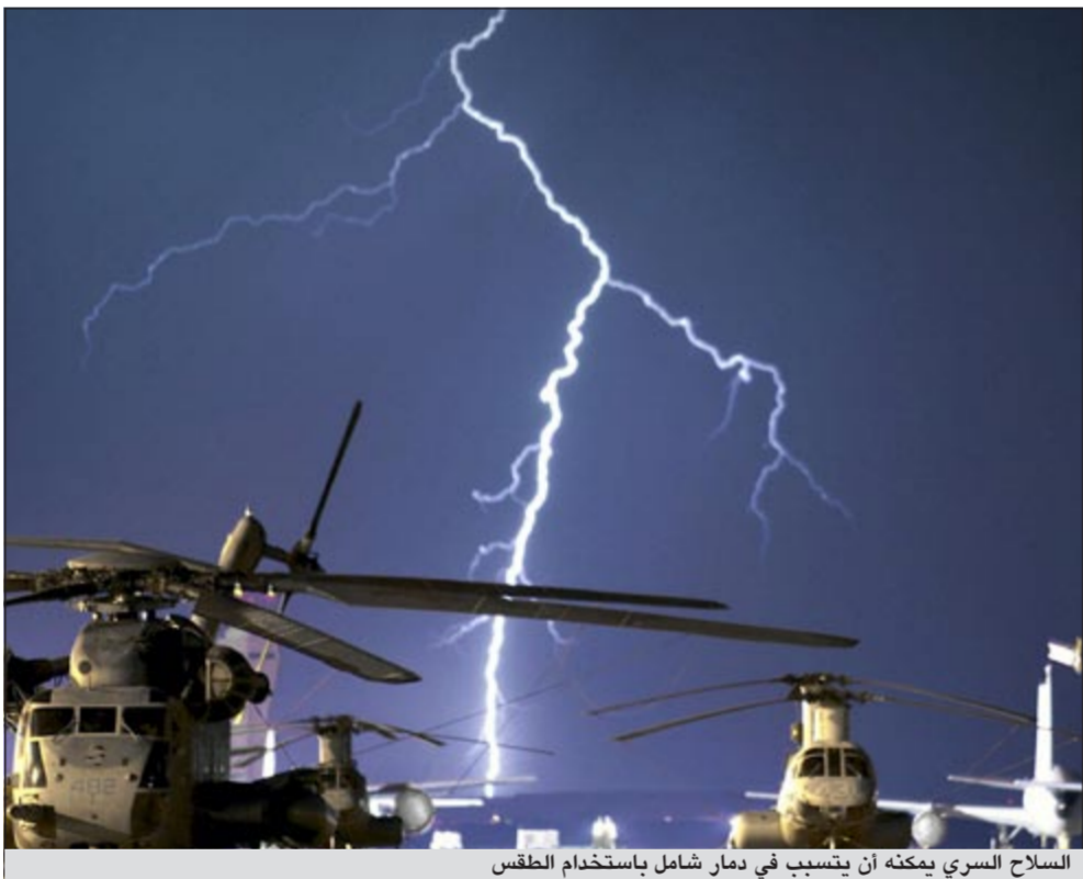
السلاح السري يمكنه أن يتسبب في دمار شامل باستخدام الطقس

واكتشف العالم أن هذا السلاح أطلقته «ناسا» عام 1991 فوق العراق والسعودية قبل حرب تحرير الكويت بعد تحميله بالسلالة النشطة من الميكروب المهندس وراثيا لحساب وزارة الدفاع الأميركية للاستخدام في الحرب البيولوجية وقد طعم الجنود الأميركيون باللحاح الوافي من الميكروب، بيد أن 47٪ منهم عاادوا مصابين به وزعمت وزارة الدفاع والصحة الأميركية بأنهم مرض غير معروف أطلق عليه «مرض الخليج».