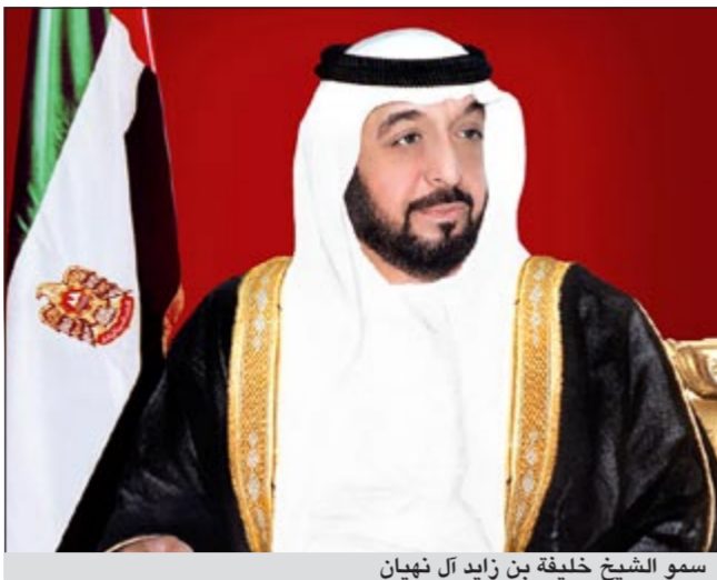
سمو الشيخ خليفة بن زايد آل نهيان

المواطنين المتعثرين ومع عدم الاخلال بحجية شبكات الضمان في الإثبات، تخصصر الحماية الجنائية المقررة في المادة 401 من قانون العقوبات الصادر بالقانون الاتحادي رقم 3 لسنة 1987 عن شبكات الضمان المقدمة من البنوك وشركات التمويل ضد المواطنين، وتحفظ النيابة جميع البلاغات وتحكم المحاكم بانقضاء جميع الدعاوى الجنائية المنظورة أمام المحاكم بجميع درجاتها المتعلقة بشبكات الضمان، ويفرج فورا عن كافة الموقوفين والمحكومين في هذه القضايا.