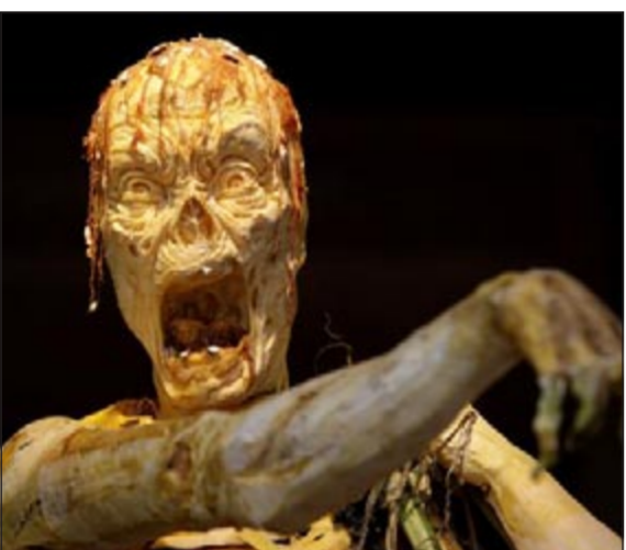
أحد التماثيل المعروضة في معرض «قتلة: البيت الذي يسكنه الكابوس»

نيويورك - أ.ف.ب: مع اقتراب عيد «هالوين»، ينظم معرض مخيف من وحي المناسبة في الصالات المظلمة لأحد المسارح في نيويورك، معيدا إلى ذاكرة الزائرين أسماء السفاحين الأكثر شهرة في الولايات المتحدة.