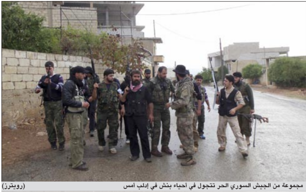
مجموعة من الجيش السوري الحر تتجول في احياء بنش في ادلب امس

من المفترض ان تنطلق «هدنة الاضحى» اليوم بين الجيشين النظامي والحر في سورية، وسط شكوك البعض في استمراريتها طويلا، وتمنيات البعض الآخر بنجاحها. قيادة الجيش السوري قالت انها ستطلق العمليات العسكرية خلال عيد الاضحى واعلنت وقتها لاطلاق النار من صباح اليوم حتى يوم الاثنين لكنها قالت انها تحتفظ بحق الرد على الهجمات والتفجيرات. وازدادت في بيان انها تحتفظ بحق الرد على قيام الجماعات الارهابية المسلحة بتعزيز مواقعها التي توجد فيها مع بدء سريان هذا الاعلان او الحصول على الامداد بالعناصر والذخيرة.