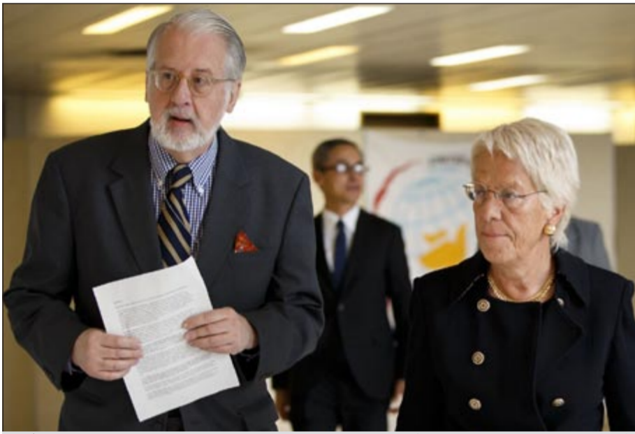
أعضاء من لجنة التحقيق الدولية بشأن جرائم الحرب (إ.ف.ب)

ان أقول لكم ان المسؤولين عن هذه الجرائم يجب ان يحاكموا». وديل بونتي التي عينت في 28 سبتمبر عضوا في لجنة التحقيق التابعة للأمم المتحدة حول الجرائم في سورية، لم تتحدث علنا سابقا.