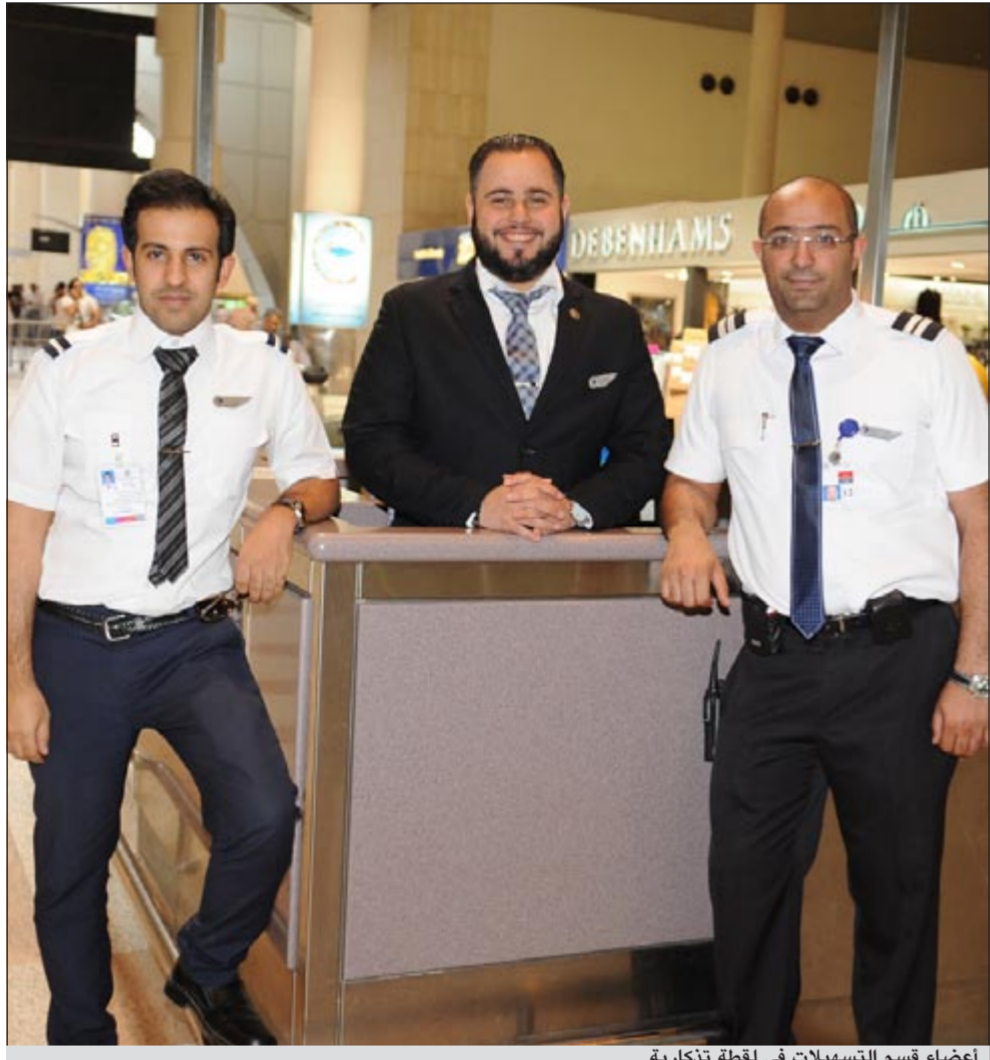
أعضاء قسم التسهيلات في لحظة تذكارية