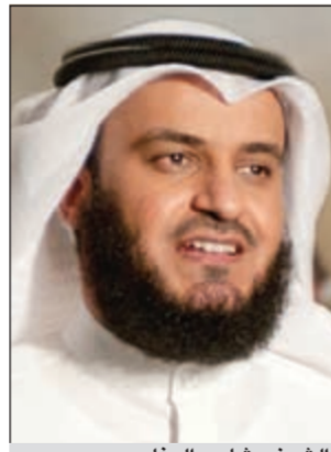
الشيخ مشاري العفاسي

متوسط إجمالي الموجودات حيث بلغت 2,69٪ كما في 30 سبتمبر 2012، مما يدل على مدى كفاءة استخدام حقوق المساهمين وفعالية استراتيجيات توظيف الموجودات». بدوره القي الرئيس التنفيذي لبنك الدوحة د. سبيترامان الضوء على الابتكارات والإنجازات والمبادرات التي حققتها البنك خلال الربع الثالث من عام 2012، مشيرا ان البنك طرح المنتج الخاص بالمشاريع الصغيرة والمتوسطة لدى فرع البنك في دولة الكويت إضافة إلى المنتجات والعروض الأخرى التي يقدمها البنك في السوق القطرية والإماراتية.