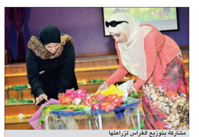
مشاركة بتوزيع الغراس لزراعتها

وأضافت المنن لقد تم غرس أشجار عدة من مختلف الألوان بأحواض الزرع المتواجدة بفناء الروضة من قبل الأطفال لوضع البسمة على وجوههم وحثهم على المشاركة الفعالة في بناء مستقبل واعد ومنتحضر.