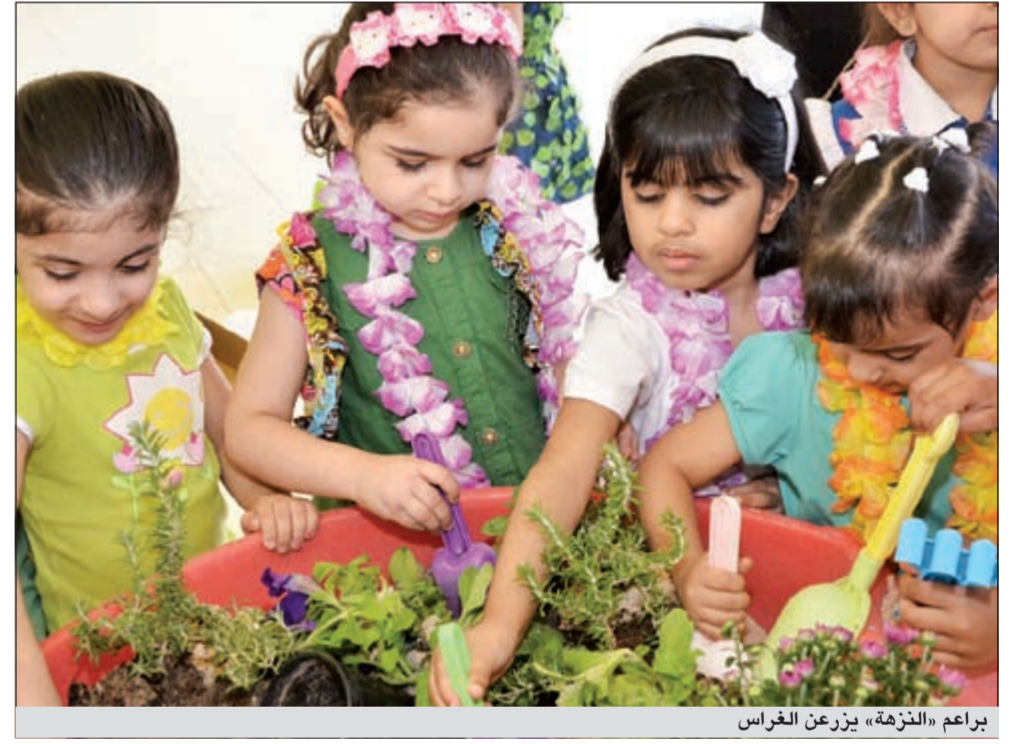
براعم «الزهرة» يزرعون الغراس