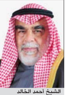
الشيخ احمد الخالد

وقال الشيخ احمد الخالد في برقيته «يسعدني ان ارفع الي مقام سموكم الكريم ونبابة عن كل منتسبي وزارة الدفاع اسمى آيات التهاني والتبريكات بمناسبة قدوم عيد الاضحى المبارك مبتهلا للباري جل شأنه ان يعيد هذه المناسبة المباركة على سموكم وانتم ترفلون بانواب الصحة والسعادة وعلى وطننا العزيز بالبرقي والازدهار وعلى الامتنب العربية والاسلامية بالجد والشكر وان يحفظكم قائد لشعبكم الوفي ويسدد على دروب الخير خطاكم لمواصلة مسيرة العطاء والاستقرار لبلدنا العزيز تحت ظل قيادتكم الحكيمة وكل عام وسموكم بخير».