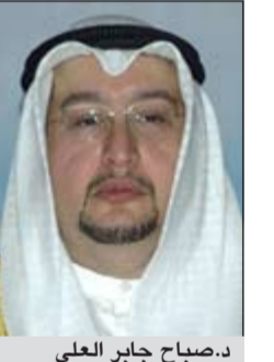
د.صباح جابر العلي

عبر فيها نبابة عن أعضاء مجلس ادارة المؤسسة والعاملبن فيها عن خالص التهاني والتبريكات بمناسبة عيد الاضحى المبارك هذه المناسبة العطرة، اعساده الله على سموه وعلى شعب الكويت بالخير واليمن والبركات داعبن الله ان يحفظه ويديم على سموه نعمة الصحة والعافية لمواصلة قيادة مسيرة الخير والعطاء لموطن العزيز نحو كل ما فيه عزته وازدهاره مبتهلا الى الباري تعالى ان يعيد هذه المناسبة العطرة على الكويت وشعبها بالخير واليمن والعزة وعلى الامتنب العربية والاسلامية بالرفعة والسؤدد، ودمتم ذخرا وعنوانا لكويتنا الحبيبة الغالية وقائدا لمسيرتها وراعيا لنهضتها.