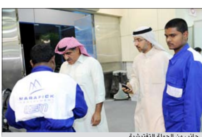
جانب من الحملة التفتيشية