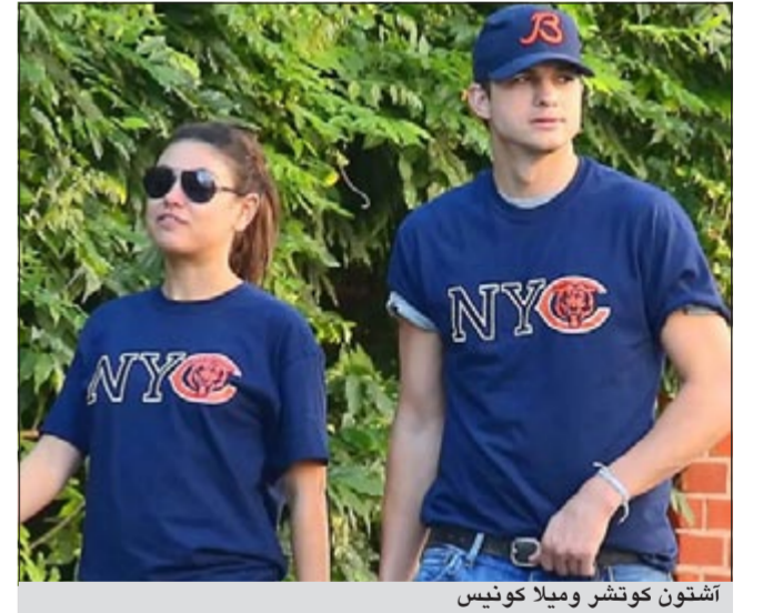
آشتون كوتشر وميلا كونيس

كوتشر يبدو انه نجح ايضا في إقناع ميلا بالانضمام الى ذلك المذهب اليهودي، حتى انه اصطحبها الى معبد الكابالا في نيويورك أكثر من مرة، خلال الفترة الماضية، ومارست جميع طقوسه، بالإضافة الى عملها في خدمة المعبد.