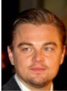
ليوناردو دي كابريو

وفي رسالة وجهها عبر البريد الإلكتروني الى مجموعة المدافعين عن الطبيعة (افسان)، دعا الممثل الى «دفع من قبل السكان» من أجل اقامة هذه المحمية في وقت تجرى فيه مفاوضات داخل اللجنة من أجل حماية الموارد البحرية الحية في القطب الجنوبي. وهذا المؤتمر الذي افتتح رسميا الثلاثاء في جزيرة هوبارت الاسترالية في مقاطعة تاسمانيا بتحور