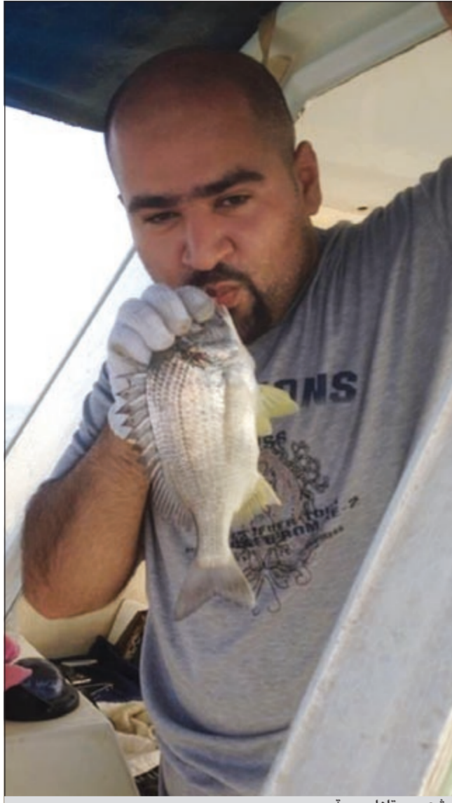
شعم يستاهل بوسة