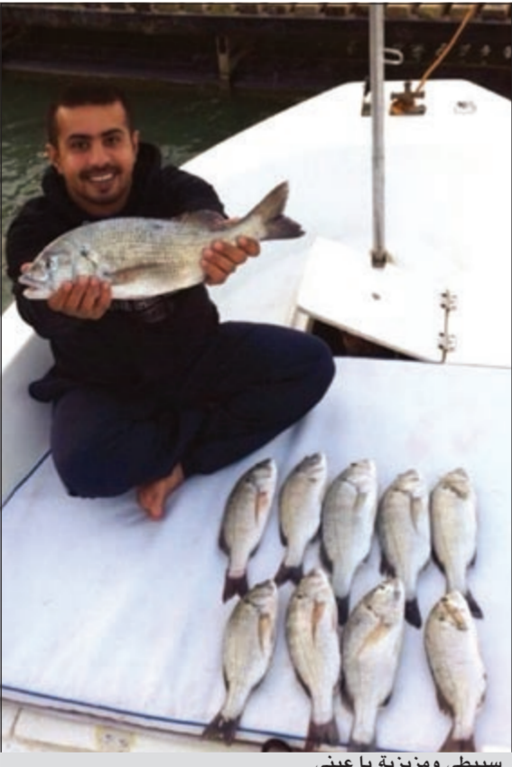
سبيطي ومزينة يا عيني