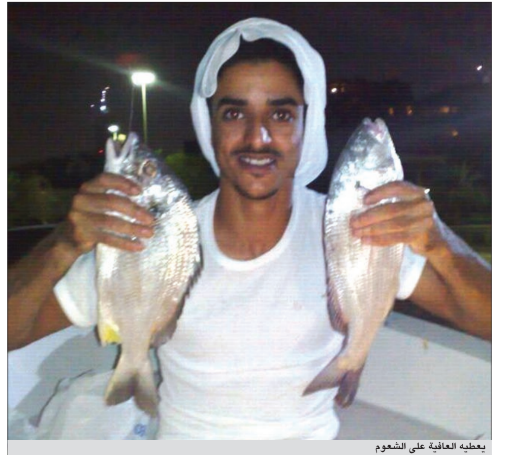
يعطيه العافية على الشعوم