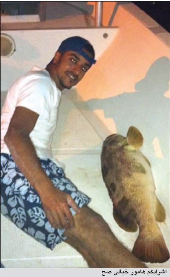
اشرايكم هامور خيالي صح