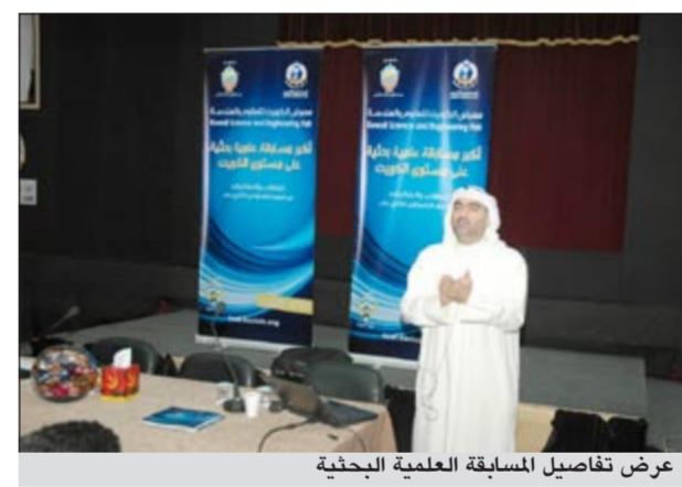
عرض تفاصيل المسابقة العلمية البحثية

وقال د.الصفار ان المسابقة تستهدف الطلاب والطالبات من الصف التاسع إلى الـ 12 «من الفئة العمرية بين 14 و 18 عاما، بغية اظهار ابداعاتهم وأنشطتهم في المجالات العلمية المختلفة وللاسهم في حل مشكلات المجتمع عن طريق البحث العلمي. وأشار إلى أن المسابقة تسمى في مجملها إلى صياغة عقل الباحث العلمي المبدع وتسلط الضوء على مراحل البحث العلمي «وتأتي من واقع اهتمامات النادي العلمي بشباب الوطن وتحقيق الأهداف التي خطط من أجلها بتجنيد طاقات الشباب ورسم البرامج التي تساعد على النمو السليم المتكامل».