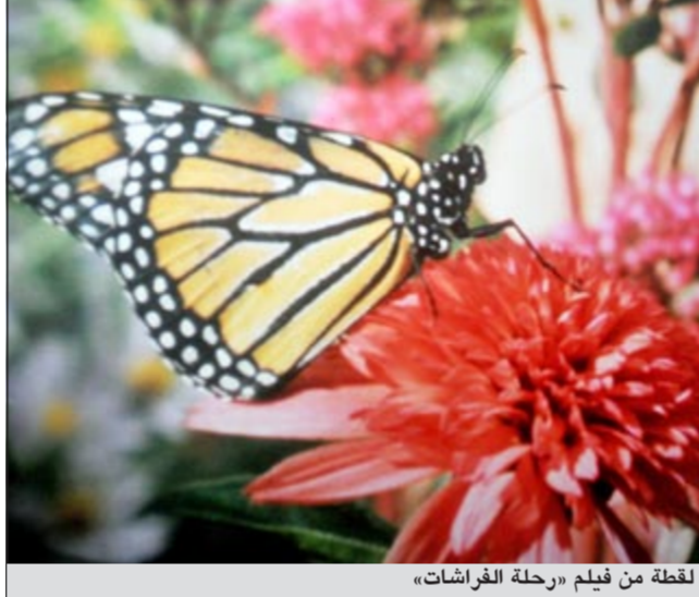
لقطة من فيلم «رحلة الفراشات»

من إنتاج شركة SK Films الثانية والخامسة مساء. جميع عروض آي ماكس خلال عطلة عيد الأضحى المبارك ستكون للفيلم الجديد «رحلة الفراشات». ويمكن لزوار المركز العلمي حجز تذاكرهم لمشاهدة فيلم «رحلة الفراشات» أو أي من المرافق الأخرى عبر موقع المركز العلمي على شبكة الإنترنت www.tsck.org.kw أو الاستفسار على 1848888، علما أن المركز العلمي سيستقبل زواره الكرام من الساعة الثانية من بعد ظهر أول أيام العيد وحتى الساعة الحادية عشرة مساء، ومن الساعة التاسعة صباحا وحتى الحادية عشرة مساء ثاني وثالث أيام العيد.