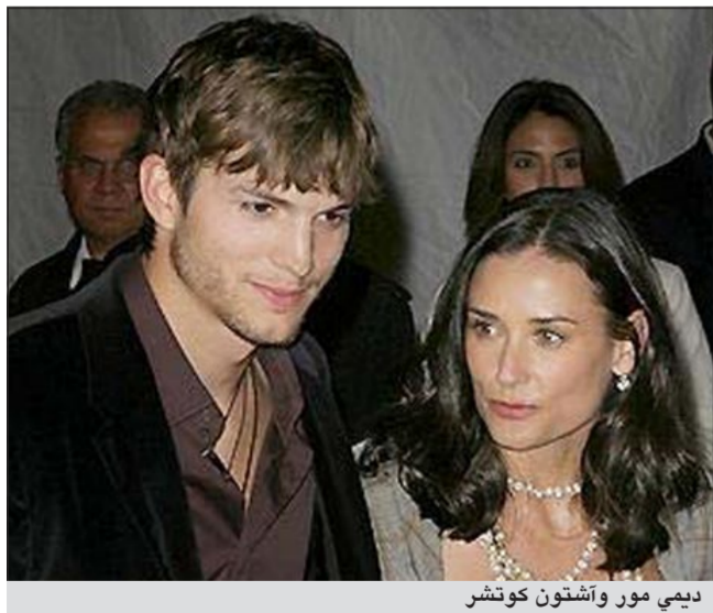
ديمي مور وأشتون كوتشر

انفصلا بعد زواج استمر 6 سنوات عندما تبين أنه كان يخونها خلال عطلة الاحتفال بذكرى زواجهما. وبدأ كوتشر بعدها علاقة مع النجمة ميلا كونيس.