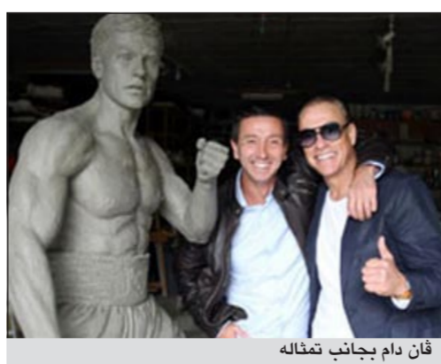
غان دام بجانب تمثاله

قدمت بلجيكيا هدية للنجم العالمي جان كلود فان دام عبارة عن تمثال تم رفع الستار عنه أمس بمناسبة عيد ميلاده 52. وضع التمثال في استاد اندرلخت الرياضي، وذلك باعتبار أن بطولة رياضية وسينمائية. يذكر أنه تم صنع التمثال من البرونز، وبأشرف فان دام مراحل صنعه بنفسه، حيث أن التمثال هو بنفس حجم فان دام الحقيقي.