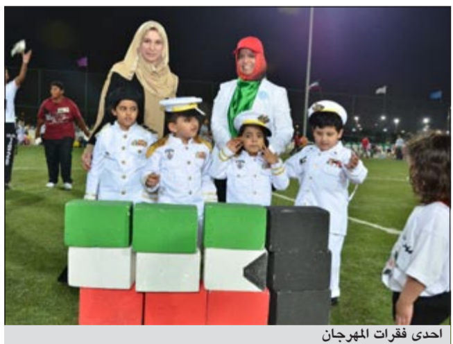
أحدى فقرات المهرجان

نظم السلامة الكهربائية وتأمين العاملين من الصدمات الكهربائية وخلافه وهو من ضمن المدينة الترفيهية حيث بلغ عدد المشاركين في البرنامج الترفيهي 13 مشاركا من موظفي الشركة وقد قام مكتب التدريب والتطوير بتنظيم البرنامج بالتعاون مع المركز الدولي للاستثمار البشري وحاضر البرنامج د.محمود إبراهيم جيلاني، ويعتبر برنامج الصيانة الكهربائية للمعدات من البرامج المهمة التي تتواءم مع متطلبات الإدارة الحديثة التي تهدف إلى رفع الكفاءة العملية لدى الفنيين العاملين في أقسام الصيانة الكهربائية وبيان مدى أهمية الصيانة الكهربائية للمعدات وكيفية التخطيط للصيانة ومن ثم التنفيذ والإشراف على عمليات الصيانة وذلك لتحقيق أعلى درجات الكفاءة للمعدات الكهربائية مع أعلى درجات السلامة للزوار وللعاملين وقد تضمن البرنامج أيضا شرحاً لأنواع الصيانة المختلفة كالصيانة الدورية والوقائية والعلاجية كما تطرق البرنامج إلى