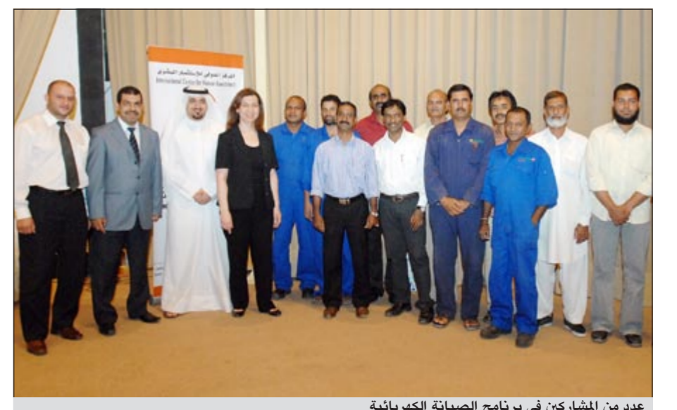
عدد من المشاركين في برنامج الصيانة الكهربائية