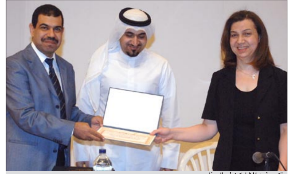
تكريم أحد المشاركين في البرنامج

نظمت شركة المشروعات السياحية برنامج الصيانة الكهربائية للمعدات والذي تم عقده في المدينة الترفيهية حيث بلغ عدد المشاركين في البرنامج الترفيهي 13 مشاركا من موظفي الشركة وقد قام مكتب التدريب والتطوير بتنظيم البرنامج بالتعاون مع المركز الدولي للاستثمار البشري وحاضر البرنامج د.محمود إبراهيم جيلاني، ويعتبر برنامج الصيانة الكهربائية للمعدات من البرامج المهمة التي تتواءم مع متطلبات الإدارة الحديثة التي تهدف إلى رفع الكفاءة العملية لدى الفنيين العاملين في أقسام الصيانة الكهربائية وبيان مدى أهمية الصيانة الكهربائية للمعدات وكيفية التخطيط للصيانة ومن ثم التنفيذ والإشراف على عمليات الصيانة وذلك لتحقيق أعلى درجات الكفاءة للمعدات الكهربائية مع أعلى درجات السلامة للزوار وللعاملين وقد تضمن البرنامج أيضا شرحاً لأنواع الصيانة المختلفة كالصيانة الدورية والوقائية والعلاجية كما تطرق البرنامج إلى