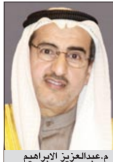
م. عبدالعزیز الإبراهيم

إثر زيارة مفاجئة قام بها مساء أول من أمس احال وزير الكهرباء والماء م. عبدالعزیز الإبراهيم صباح أمس عدداً من موظفي مركز الكول سنتر 152 إلى التحقيق، بعد اكتشافه وجود ثلاثة موظفين فقط من أصل 13 كان يفترض تواجدهم بالعمل خلال هذا الوقت. ووضحت مصادر مطلعة أن الوزير الإبراهيم أبدى استياء شديداً من غياب الموظفين خاصة أنه وجد أحد الموظفين الثلاثة مستقبلاً في غفوة، مشيرة إلى أهمية مركز الكول سنتر كونه المسؤول عن استقبال شكاوى المواطنين والمقيمين حول انقطاعات الكهرباء والماء، وذكرت المصادر أن الوزير الإبراهيم سبق أن حذر موظفي الكول سنتر عن التعيب مطلع الصيف الماضي خاصة في ظل الشكاوى المتكررة من المواطنين حول عدم رد موظفي المركز على اتصالاتهم ما يطيل من فترة انتظار أصحاب الشكاوى لوصول فرق الطوارئ إلى المواقع المتضررة.