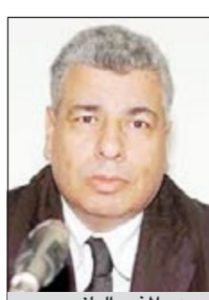
د. عبدالمنعم الباز

يخصص ملتقى الثلاثاء الثقافي ندوته المقررة في السابعة من مساء الثلاثاء 23 الجاري بجمعية الخريجين، لمناقشة المجموعة القصصية «استثناس الصمت» للصادرة حديثاً ضمن سلسلة «كلمات» عن إقليم شرق الدلتا الثقافي بالهيئة العامة لقصور الثقافة للقاص المصري د. عبدالمنعم الباز وهي المجموعة السادسة في سيرته القصصية بعد: الشاطر حسن يخيب 1987، مشكل أوكسين فقط 1989، صلوات خاصة 1991، بق القلب 1995، قليل من السماء 2002، بالإضافة إلى مجموعة بعنوان «افتتاحات» صدرت عام 1993 وصنفها الباز على أنها «سطور خاصة».