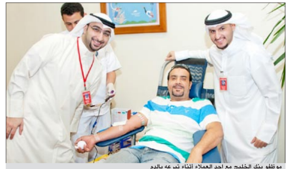
موظفو بنك الخليج مع أحد العملاء أثناء تبرعه بالدم

أعلن بنك الخليج استمرار حملة «تبرع للحياة» للتبرع بالدم بنجاح كبير، حيث ساهمت في إنقاذ حياة 1098 شخصا حتى الآن. وقد شارك في هذا النجاح 366 من المتبرعين هذا الأسبوع فقط، وقد جمع هذه الإحصاءات الأخيرة وقام بتوثيقها بنك الدم. وتهدف حملة بنك الخليج «تبرع للحياة» إلى توعية المجتمع بأن التبرع بالدم هو عمل سهل وبسيط للغاية إلا أن نتائجه تؤدي إلى إنقاذ الأرواح. وشملت الجولة الثالثة من حملة بنك الخليج «تبرع للحياة» كلا من فرع الجهراء في 5 سبتمبر، وفرع الجهراء في 2 في 12 سبتمبر، وفرع صباح الناصر في 19 سبتمبر وفرع ميدان حولي في 10 أكتوبر، وستستمر حتى نهاية السنة من خلال فروع أخرى لبنك الخليج بالإضافة إلى العديد من الأماكن الأخرى، وذلك لإتاحة فرصة المشاركة أمام أكبر عدد ممكن من أفراد المجتمع وتشجيعهم على دعم هذه القضية الإنسانية النبيلة. وبهذه المناسبة، قال مدير عام شؤون مجلس الإدارة في بنك الخليج فوزي النخيان: «إن رسالتنا هي توعية المجتمع بأهمية التبرع بالدم وبيان دوره في إنقاذ حياة الإنسان، ونحن سعداء للغاية بالنجاح الباهر الذي حققته هذه المبادرة حتى الآن، حيث ساهمت في إنقاذ حياة 1098 شخصا وتخفيف من معاناة أسرهم». وأضاف قائلا: «وتأتي حملة «تبرع للحياة» في إطار التزام بنك الخليج بالمسؤولية الاجتماعية من خلال طرح مجموعة من المبادرات الإنسانية والاجتماعية، وذلك حرصا على تحقيق الخير والمنفعة لجميع من في الكويت، ونحت الجميع، من مواطنين ومقيمين في الكويت، على المشاركة في حملة «تبرع للحياة» والإقبال على التبرع وتشجيع الآخرين على ذلك بهدف تعزيز صحة وسلامة المجتمع الكويتي».