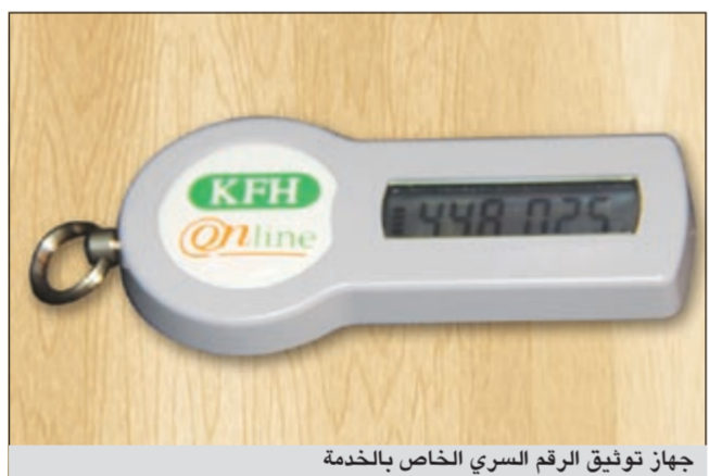
جهاز توثيق الرقم السري الخاص بالخدمة

ودعا الغيث جميع الشركات والمؤسسات للاستفادة من الخدمة الجديدة التي تقدم بشكل تقني كامل ومتكامل ومتاحة للعملاء على مدار الساعة وبراعي فيها عناصر الأمان والجودة من حيث توفير الوقت والجهد، كما أنها تلائم التطورات الحديثة في مجال عمل الشركات والمؤسسات بالداخل والخارج والتي لم يعد هناك غنى عنها الآن، مشيرا إلى قدرات الشركات والمؤسسات في هذا المجال.