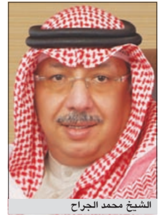
الشيخ محمد الجراح

قال رئيس مجلس إدارة بنك الكويت الدولي الشيخ محمد الجراح: إن البنك حقق إيرادات تشغيلية بلغت 32,2 مليون دينار في نهاية سبتمبر 2012 مقابل 26,7 مليون دينار في نهاية سبتمبر 2011 أي بزيادة بلغت نسبتها 21٪ في حين ارتفعت الأرباح الصافية للبنك إلى نحو 9,4 ملايين دينار مقابل 8,2 ملايين دينار للفترة ذاتها من 2011، أي بنسبة زيادة بلغت نسبتها 15٪.