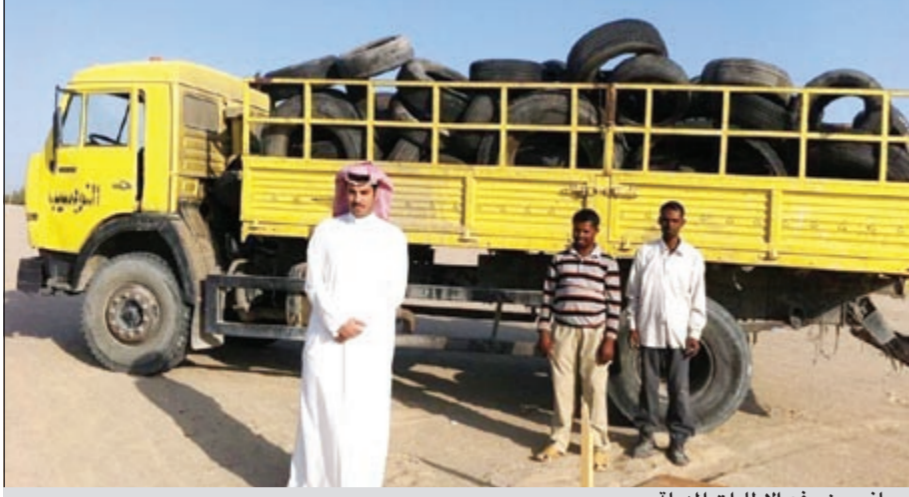
جانب من رفع الإطارات المهملة

28 نقلة من الأنقاض وتنظيف منطقة الشاليهات وترحيل المخلفات التي وقع الردم الواقع على طريق الدائري السابع، فيما تم رفع حمولة 9 هاف لوري من الإطارات التي قام البعض باستخدامها لحجز عدد من مواقع المخيمات، مشيراً إلى أنه قد تمت إزالتها وترحيلها إلى منطقة رحيبة. ولفت المطيري إلى ضرورة التقيد بالضوابط والإستراتيجيات التي حددتها البلدية خلال فترة إقامة المخيمات الربيعية التي تبدأ من الأول من نوفمبر حتى نهاية مارس من كل عام ومنها عدم تجريف التربة أو إقامة الأرواف والسواتر الترابية أو وضع الإطارات حول المخيمات لما يصاحب هذه الظاهرة من انعكاسات سلبية على البيئة.