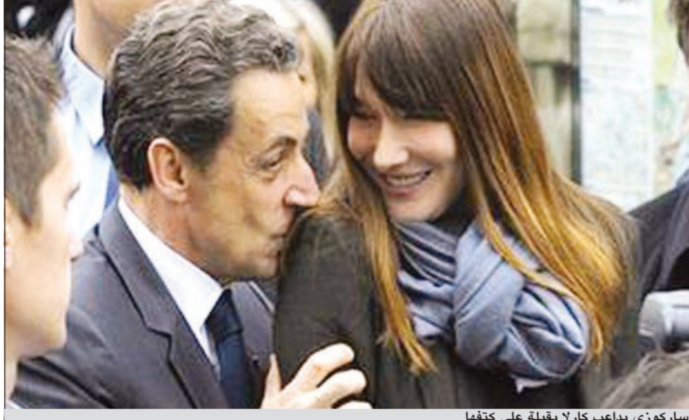
ساركوزي يداعب كارلا بقبلة على كتفها

هولاند، أجبرته على العيش على الجين الناعم - لم تكن متوافرة لديها في ذلك الوقت. فقررت أن تعد الطيبات في فرع آخر لطمعها ثم استقلت بنفسها دراجتها الهوائية الى ذلك المطعم لتعود بها الى الزوار المهمن. يذكر أن خسارة ساركوزي الانتخبات الرئاسية الأخيرة أمام مرشح الاشتراكيين، فرانسوا