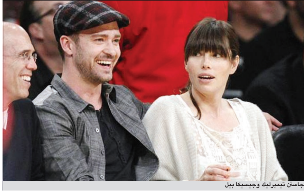
جاستن تيمبرليك وجيسكا بيل

لوس أنجليس - رويترز: قالت مجلة يو اس ويكلي المهتمة بأخبار المشاهير ان الممثل جاستن تيمبرليك وخطيبته جيسكا بيل سيقومان حفل زفاف يحضره حشد من النجوم خلال ايام في ايطاليا، وقالت المجلة ان العروسين اقاما حفلا صغيرا غير رسمي الاربعاء الماضي في بوليا بايطاليا.