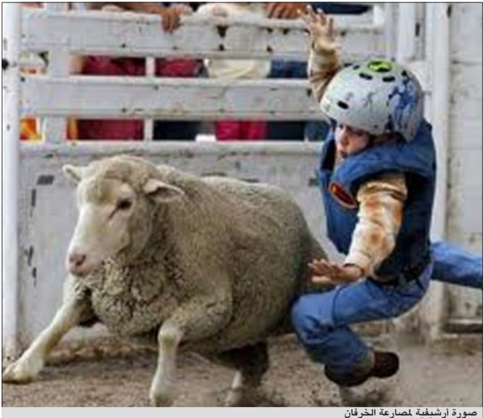
صورة ارشيفية لمصارعة الخرفان

والتبن ذي النوعية الجيدة، وتراوح فترة ربط الكباش ما بين سنتين إلى 4 سنوات ويعدها يكون جاهزا للنزول إلى الميدان.