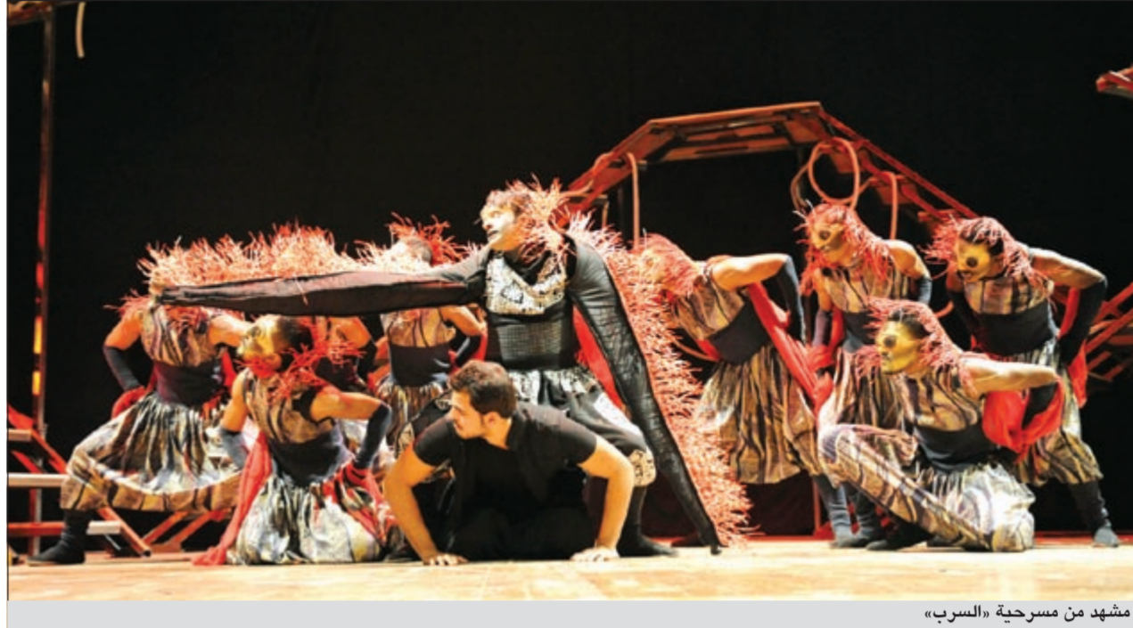
مشهد من مسرحية «السرب»

ولفت دهاني النصار الى وجود أكثر من شخص لهم الفضل على فرقة تياترو في مقدمتهم عميد المعهد العالي للفنون المسرحية د.فهد السليم الذي تبنى الفرقة منذ بدايتها وشدد د.فهد السليم على ان المسرح الكويتي بخير وان مشاركة هؤلاء الشباب خير دليل على ذلك كما كشف عن إعداد فرقة جديدة ستظهر في 2012/12/12 وعدد أفرادها 12 فناناً وفنانة، لافتاً الى المسئولية العالي الذي ظهر بها الشباب الكويتي قائلاً: