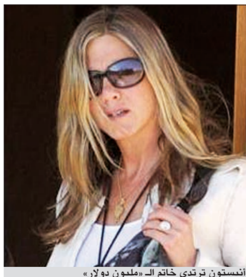
انيستون ترتدي خاتم الـ «مليون دولار»

روبرتز: طرح علماء من جامعة هارفارد نظرية جديدة تذهب إلى القول إن القمر كان يوماً جزءاً من الأرض وانفصل عنها بعد اصطدام هائل بجرم آخر. وفي دراسة نشرت اول من امس في دورية ساينس قالت سارة ستجوارت وماتيجا شوك إن نظريتهما من شأنها أن تفسر اسباب التشابه بين الأرض والقمر في المكونات والعناصر الكيميائية. وقال إن الأرض كانت تدور حول نفسها أسرع كثيراً في الوقت الذي تشكل فيه القمر وكان اليوم الواحد يستمر ساعتين إلى ثلاث ساعات فقط. وقال العلماء في تفسير نشر على موقع هارفارد انه مع دوران الأرض حول نفسها بهذه السرعة