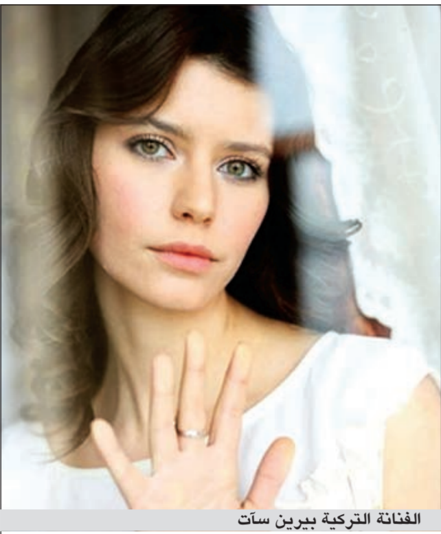
الغناء التركية بيرين سات

تستكمل قناة ام بي سي المسلسل التركي فاطمة الذي عرضت جزأه الاول مع انطلاق قناة ام بي سي مصر والمسلسل حظي بشعبية كبيرة ونسبة متابعة عالية في الدول العربية وهو من بطولة النجمة التركية بيرين سات والنجم انجين اكويوك.