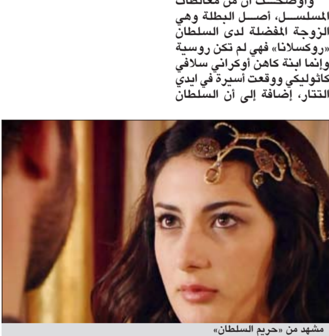
مشهد من «حريم السلطان»

وأضافت ان 60% من أحداث المسلسل حبكة درامية، و40% حقائق تاريخية، وبذلك فقد شوه المسلسل شخصية تعتبر من رموز التاريخ الإسلامي، ولم تظهر الحقيقة في التاريخ العثماني، وعلى سبيل المثال لا الحصر أخرج المسلسل نظام الحريم العثماني بشكل خاطئ تماماً، حيث أوضح ان الرجال يختلطون بالنساء بشكل طبيعي جداً وهذا خاطئ تماماً، لأنه في الواقع لم يدخل إلى القصر النسائي رجل غريب يوماً إلا السلطان والطبيب في بعض الأحيان، بينما يتواجد الحرس خارج الحريم، حتى أنه لا يوجد الاغوات داخل الحريم، لأن النساء لا يجوز لهن الظهور على غير المحارم.