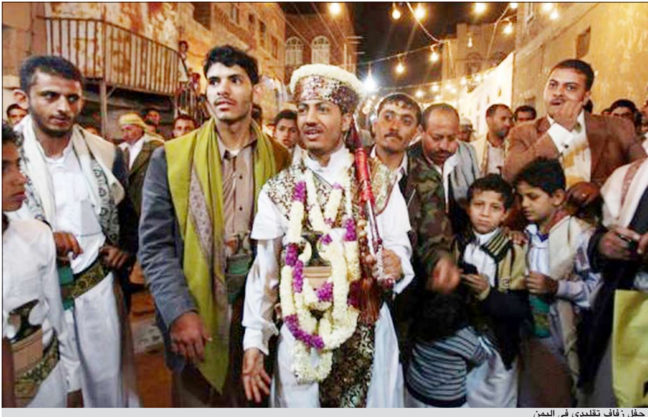
حفل زفاف تقليدي في اليمن