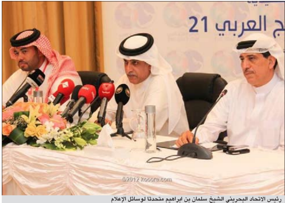
رئيس الاتحاد البحريني الشيخ سلمان بن ابراهيم متحدثا لوسائل الإعلام