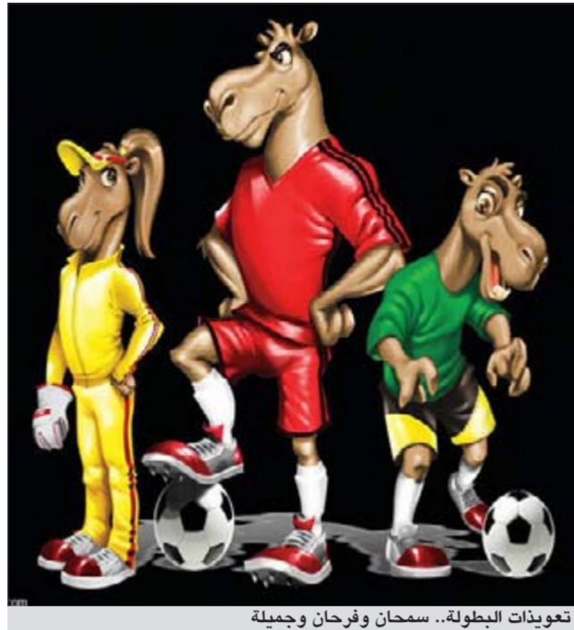
تعويضات البطولة.. سمحان وفرحان وجميعة