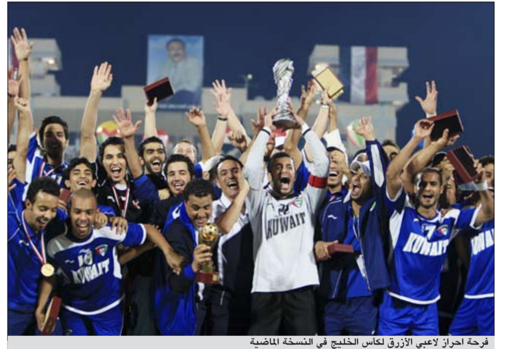
فرحة احراز لاعبي الأزرق لكأس الخليج في النسخة الماضية