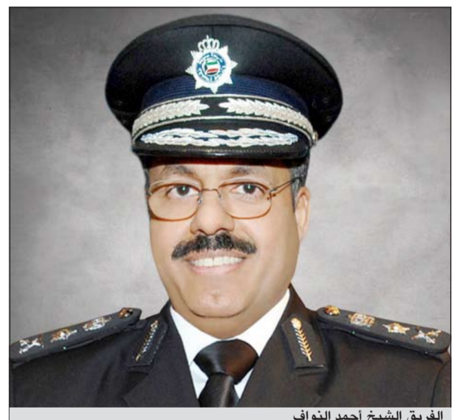
الفريق الشيخ أحمد النواف

ووصل إلى أرض البلاد كل من الوفد اليمني برئاسة رئيس اتحاد الشرطة العميد علي محمد الحسام بالإضافة إلى الوفد البولندي والفريق الياباني لينا عضو المكتب التنفيذي ومونيكا ايغار عضو اللجنة الفنية في حين تأجل وصول بعض الوفود لساعات كالوفد الكندي. من جانبه أكد العميد محمد الحسام رئيس اتحاد الشرطة اليمني أهمية البطولة على المستوى العالمي لاسيما بلاده اليمن مشيرا إلى أن اليمن بالغرب على الكويت استضافة مثل هذه البطولات والانشطة العالمية.