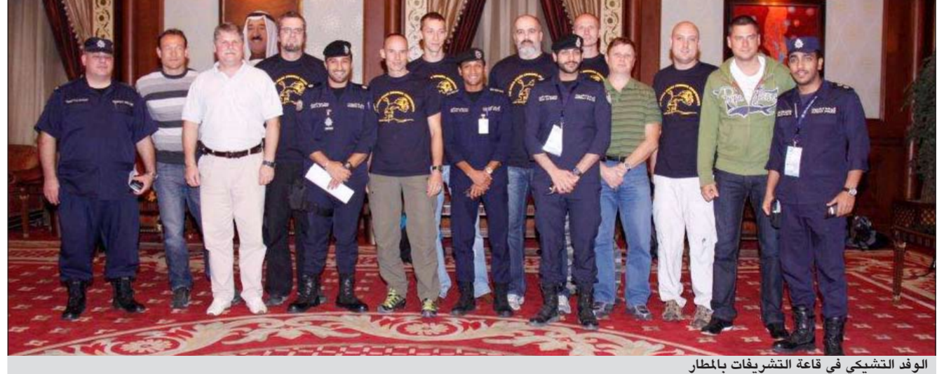
الوفد التشيكي في قاعة التشريفات بالمطار

وتتعلق منافسات البطولة رسميا غدا السبت على مجمع احواض السباحة بالنادي العربي