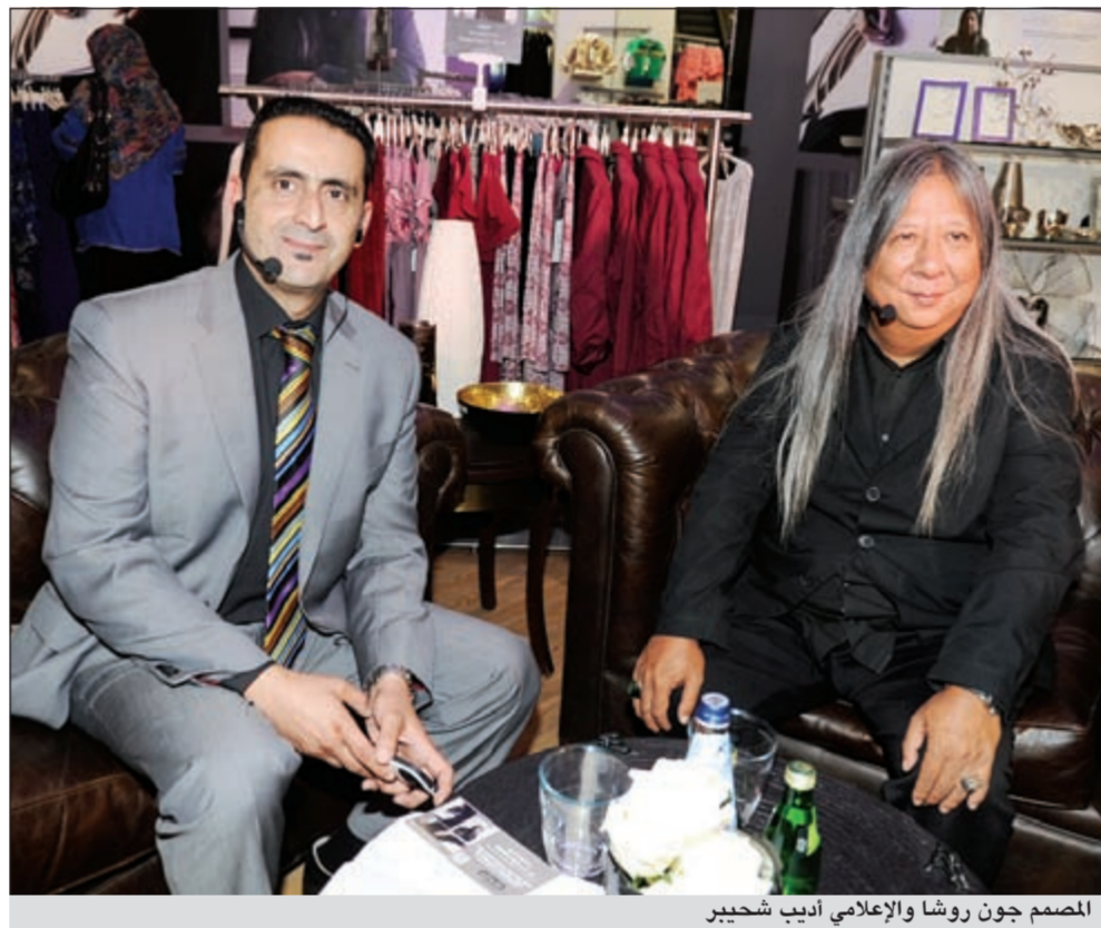
المصمم جون روشا والإعلامي أديب شحيبير

جوائز الأزياء البريطانية. يتميز أسلوب جون بمزيج فريد من الثقافة السلطانية والصينية التي تمنح مجموعته سمات مميزة للغاية. كما أن استخدامه للمسود الطبيعية وفلسفة التصاميم العضوية تتجلى بوضوح في مجموعته لخريف وشتاء العام 2012. يدير المصمم خطوط الأزياء الخاصة به وهي جون روشا، جون روشا جينز وروشا جون روشا إلى جانب تقديم الملابس والإكسسوارات لمحلات «دبنهامز».