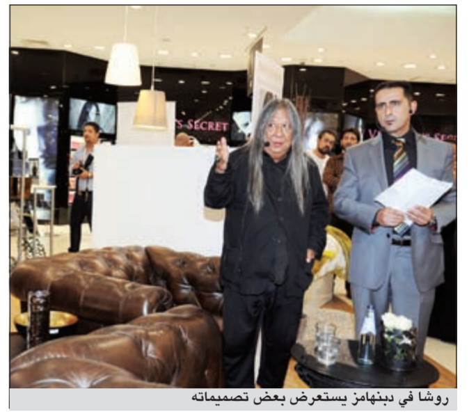
روشا في دبنهامز يستعرض بعض تصميمااته