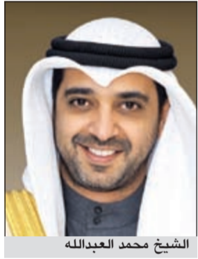
الشيخ محمد العبدالله

وختم العبدالله كلمته مؤكداً أن الكويت «لم ولن تدخر جهوداً في مواصلة دعم وتقديم المساعدات للدول النامية عامة والدول الأفريقية بشكل خاص عبر مؤسساتها الرسمية وقطاعها الخاص وأن تلك المساعدات تعتبر «نهجاً ثابتاً في سياسة الكويت الخارجية» انطلاقاً من قناعاتها بان النهوض باقتصادات تلك الدول ومساعدتها على تحقيق أهدافها الإنمائية سيعد مساهمة بالغة على الجميع ويعزز من أفاق الشراكة والتعاون ويؤدي من مناة النظام التجاري والاقتصادي العالمي.