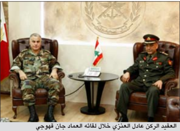
العقيد الركن عادل العنزي خلال لقائه العماد جان فهوجي

من مختلف أطيافه للكويت أميرا وحكومة وشعبا على دعمهم المستمر للبنان.