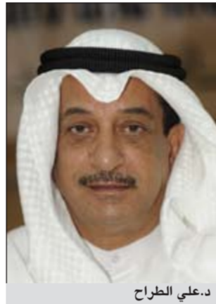
د. علي الفراج

باريس - كونا: أعلن مندوبنا الدائم لدى منظمة الامم المتحدة للتربية والعلوم والثقافة (يونسكو) السفير د. علي الفراج امس ان المجلس التنفيذي للمنظمة أقر مقترح الكويت للاحتفال باليوم العالمي للغة العربية. وقال السفير الفراج لـ «المجلس التنفيذي عقد اجتماعا اليوم وأقر بالإجماع اقتراح الكويت باحتفال اليونسكو في يوم 18 ديسمبر من كل عام يوما عالميا للغة العربية». وكان مقترح الكويت قدم للمجموعة العربية التي بدورها تبنته ورفعته للمجلس التنفيذي لمنظمة اليونسكو لإقراره وسوف يرفع بعد ذلك لإتباع الجمعية العامة في اجتماعها المقرر القادم. وأوضح المندوب الدائم ان «اقتراح الكويت جاء من منطلق الحرص على أهمية اللغة العربية لأنها تقوم بالفكر عن الثقافة والحضارة العربية من ناحية وأهمية ترسيخها والدفاع عنها في منظمة اليونسكو».