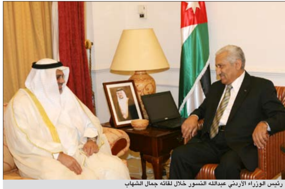
رئيس الوزراء الأردني عبدالله النسور خلال لقائه جمال الشهاب

خلاله النسور توجهاته نحو سبل التعاون بين البلدين خاصة في المجال العدلي (القضائي والقانوني). وكان الشهاب قد اطلع على تجربة المعهد القضائي الأردني ويبحث مع مديره العام علاقات التعاون المشترك وسبل تعزيزها لخدمة مرفق القضاء في البلدين.