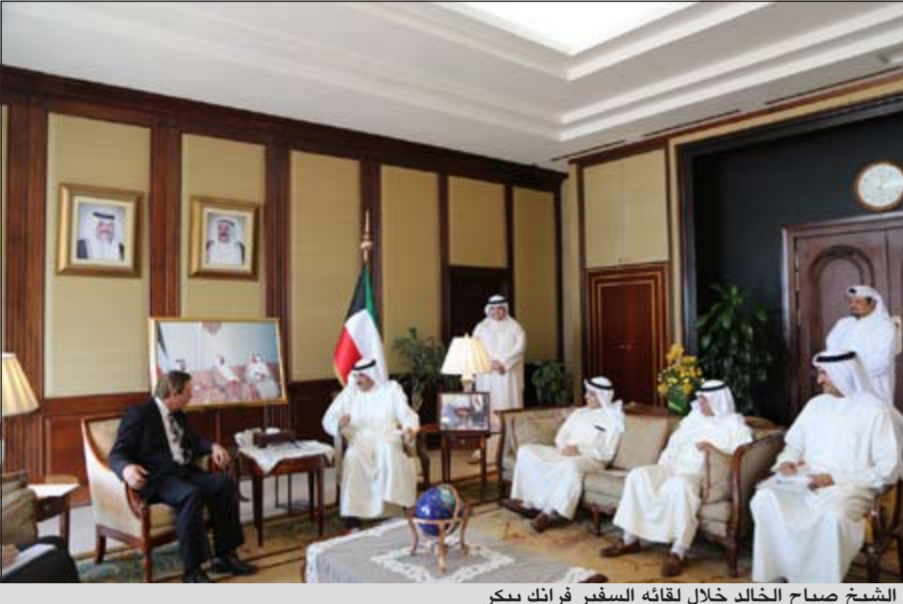
الشيخ صباح الخالد خلال لقائه السفير فرانك بيكر

والوفد المرافق للوزير الضيف. وكان الشيخ صباح الخالد استقبل صباح امس في مكتبه في الوزارة المبعوث الخاص لرئيس وزراء مملكة كمبوديا ومستشار الحكومة الكمبودية آنج رولاند. وتم خلال اللقاء بحث العلاقات الثنائية بين البلدين الصديقين والقضايا محل الاهتمام المشترك. وحضر اللقاء من الجانب الكويتي مدير ادارة آسيا السفير محمد المجرن الرومي ومدير ادارة مكتب نائب رئيس مجلس الوزراء وزير الخارجية السفير الشيخ د. أحمد ناصر المحمد وسفيرنا لدى مملكة كمبوديا ضرار التويجري. كما حضر اللقاء من الجانب الكمبودي سفير مملكة كمبوديا لدى الكويت كيم لونغ والوفد المرافق للوزير الضيف. واستقبل الشيخ صباح الخالد امس ايضا سفير المملكة المتحدة لدى البلاد فرانك بيكر. وحضر اللقاء مدير ادارة مكتب نائب رئيس مجلس الوزراء وزير الخارجية السفير الشيخ د. أحمد ناصر المحمد.