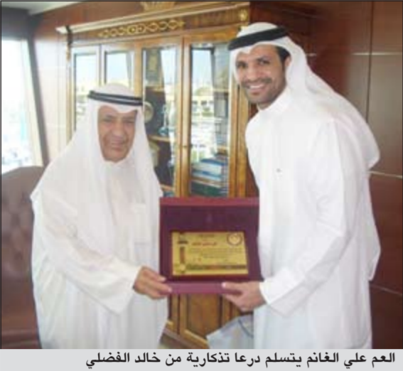
العم علي الغانم يتسلم درعاً تذكارية من خالد الفضلي

استقبل رئيس غرفة وصناعة الكويت علي ثنيان الغانم حارس مرمى نادي الكويت والمنتخب الوطني السابق خالد الفضلي الذي قدم له دعوة لحضور مباراة اعتزاله التي ستقام 14 نوفمبر المقبل على ستاد نادي الكويت بين المنتخب الوطني ونظيره البحريني.