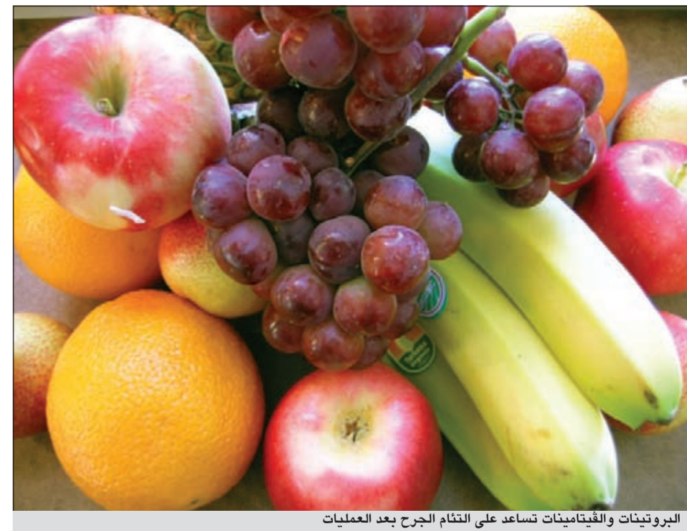
البروتينات والفيتامينات تساعد على التئام الجرح بعد العمليات

طويلة، أو نتيجة الحمل المتكرر، أو زيادة الوزن، أما الثانوية فهي التي تظهر نتيجة انسداد في الأوردة الداخلية للساقين وعلاجها يتراوح حسب شدتها ودرجتها، فعمليات الدوالي الثانوية لاتزال الأبعلاج السبب الأساسي اي اذا كان هناك انسداد في الأوردة العميقة للساقين.