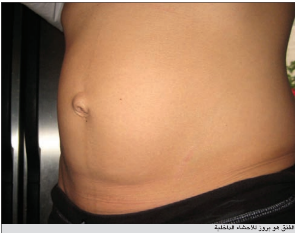
الفتق هو بروز للأحشاء الداخلية