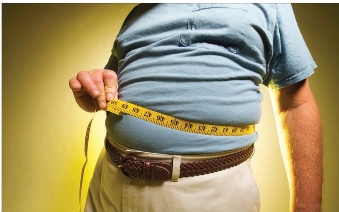
دوالي الساقين تحدث نتيجة الوقوف لفترات طويلة أو زيادة الوزن

● البعد عن السموم البيضاء: يجب تقليل استهلاك المرء من الملح والسكنر، فالسكر يحتوي على كميات كبيرة من السعرات الحرارية التي تعرف باسم السعرات الحرارية الفارغة التي لا تساهم في فقدان الوزن بل اكتساب المزيد منه، أما الأملاح فتعمل على احتجاز الماء بالجسم وبالتالي يجد المرء بثقل في فقدان الوزن. ● شرب الشاي الأخضر: يحتوي الشاي الأخضر على مضادات أكسدة تعزز من عملية التمثيل الغذائي بالجسم، لذا يوصي الخبراء بشرب من 3 - 5 أكواب من الشاي الأخضر يوميا لجني ثمار فوائده والمساهمة في حرق دهون الجسم بمزيد من الفاعلية. ● تناول الفاكهة والخضراوات الطازجة: اتفق العلماء على أهمية الفواكه والخضراوات لصحة الإنسان، وأهم ما يميز الخضار والفاكهة هو انخفاض نسبة السعرات الحرارية بها، وأكبر مثال على ذلك أن نسبة السعرات الحرارية الموجودة ببطيخ كبير من الخضراوات هي نفس النسبة الموجودة بملعقة واحدة من الحساء الدسم. ● الحصول على قدر كاف من النوم: لابد أن يحافظ الإنسان على صحته بالراحة والنوم، لأنه إذا ظل في حالة تعب وإرهاق لن تقوم الأعضاء بأداء وظائفها على نحو فعال وبالتالي ستبوء محاولات فقد الوزن بالفشل، ففقدان الوزن من الممكن أن يحدث سريعا إذا حافظ الإنسان على صحة جسده وعلى نمط حياته المتوازن. ● ممارسة التمارين الرياضية: - الإنسان بحاجة إلى ممارسة تمارين القلب والأوعية الدموية على مدار 45 دقيقة بشكل يومي لحرق دهون الجسم، ومن الأنشطة الرياضية التي تساعد على ذلك تمارين الأيروبيك والسباحة. - ممارسة تمارين رفع الأثقال تعمل على حرق دهون الجسم بفعالية، كما تبني العضلات وتدعم عملية التمثيل الغذائي بالجسم، ومن ثم حرق المزيد من السعرات الحرارية، فلابد من إدراج مثل هذه الأنشطة ضمن برنامج اللياقة للشخص.