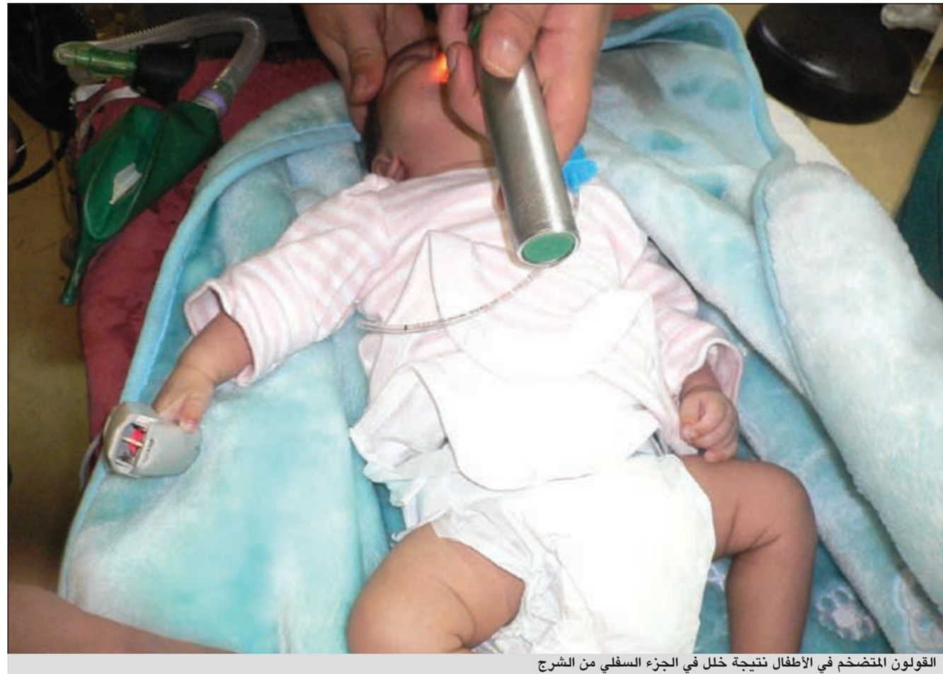
القولون المتضخم في الأطفال نتيجة خلل في الجزء السفلي من الشرج

ما الجراحات التي يمكن إجراؤها بالمنظار غير استئصال المرارة؟ ● جراحات المناظير اليوم