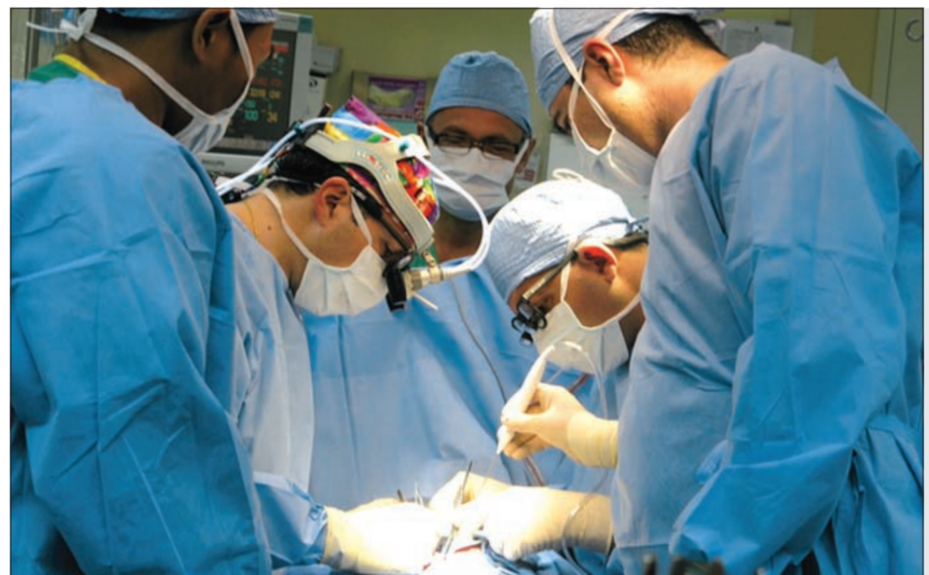
انفجار الزائدة يسبب الجسم وربما يؤدي إلى الوفاة

1 - التهاب في مكان الحقن. 2 - ظهور حبوب مماثلة لحب الشباب. 3 - حدوث تورمات بالوجه مع مرور الوقت خاصة مع استعمال الفلرز التي تحتوي على حبيبات الميكروسفيرز والتي قد تحتاج إلى جراحة لإزالتها. 4 - احتمال تكون اجسام مضادة ضد الفلرز مما يؤثر على فاعليته عند الحقن مرة أخرى. 5 - انتقال المادة المحقونة من مكان إلى آخر بالجانبية (على سبيل المثال من الخدود إلى أسفل الفك). لذا يجب الموازنة بين المنفعة العائدة على مستخدم حقن الفلرز وبين الاضرار التي قد تحدث منها واتخاذ القرار الصائب بعد اختيار الطبيب المتخصص ذو الخبرة ومعرفة رأيه.