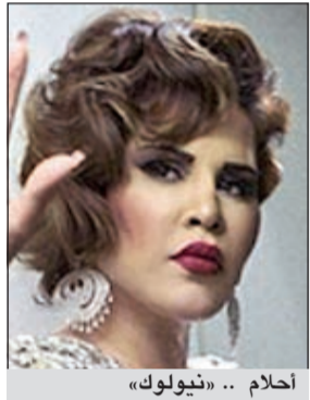
أحلام .. «نيولوك»

قد تكون الفنانة الإماراتية أحلام إحدى أكثر الفنانات تغييرا لستائيل ملابسها ومكياجها وشعرها على الساحة الفنية العربية، وها هي مؤخرا تشارك معجبيها بصور جديدة لها غير حسابها في «الاستغرام» لتظهر في كل منها بلوك مختلف تماما. ففي المجموعة الأولى من الصور ظهرت بساتيل «ريتر»، مستوحى من نجما هوليوود في عصرها الذهبي، قرأناها بالشفاه الحمراء،