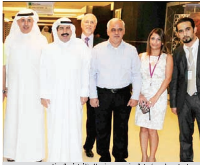
بهمن يتوسط عددا من الحضور وبعض الموظفين في السنتر