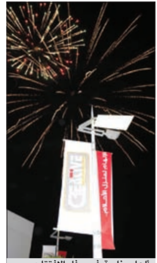
العاب نارية في حفل الافتتاح

جمع أكثر من 70 محلا لأرقى العلامات التجارية العالمية والمحلية الرائدة في عالم الأثاث والديكور ومختلف الاحتياجات المنزلية.