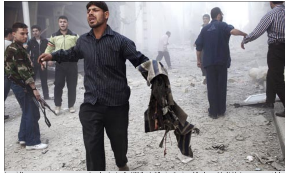
مواطن سوري يحمل اشلاء قريب له قضى في قصف القوات النظامية على احياء حلب

في سياق متصل، اعتبرت وسائل الاعلام التركية حديث وزير الخارجية أحمد داود أوغلو بالمؤتمر الصحافي المشترك مع نظيره الألماني جيدو فيسترفيله في اسطنبول بأنه تحذير وتهديد وتصعيد آخر ضد سورية من خلال ذكره «أنا» رانيا اي تهديد للامن القومي فسند من دون تردد وان تركيا لن تتردد في الرد على اي انتهاك سوري لحدودنا». وأضاف داود أوغلو، ان رد تركيا على سورية هو إجراء دفاعي وراعي وسنعمل كل ما هو ضروري للدفاع عن أنفسنا وإن الهجوم الذي قامت به القوات السورية على بلدة «أقشة قلعة» هو هجوم على حلف الناتو أيضاً.