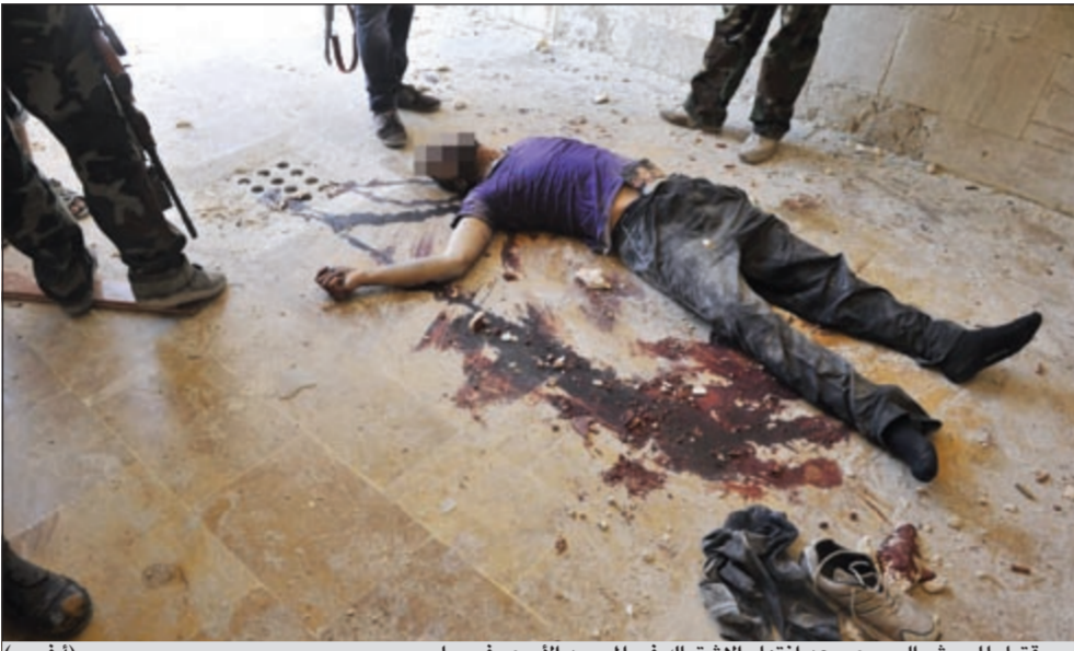
..وقتل للجيش السوري بعد انتهاء الاشتباك في المسجد الأموي في حلب

ويقول مراسل وكالة أنباء الشرق الأوسط في دمشق إن المئات من رجال الجيش والشرطة يكامل عتادهم انتشروا في منطقة وسط المدينة والتي تضم مبنى مجلس الشعب وسوق الصالحية وشارع العابد (أحد أكبر شوارع دمشق).. فيما تم إغلاق معظم الشوارع أمام السيارات. ونتيجة لمنع مرور السيارات في شارع العابد أصبح لزاماً على سكان المنطقة الراغبين في الاتجاه إلى أي مكان أن يسبوا حوالي كيلومترين بطول شارع العابد حتى يتفنى لهم الوصول إلى حي وسيلة تنقلهم إلى الجهات التي يقصدها.. فيما يتعرض السائرون لعمليات تفتيش دقيقة خاصة الذين يحملون حقائب أو لفافات.