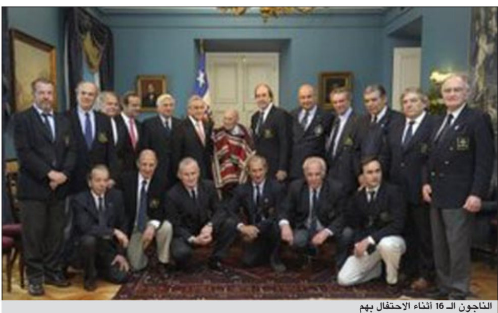
الناجون الـ 16 أثناء الاحتفال بهم

مونتفيدو - د.ب.: قبل 40 عاما نجا 16 رابكا من حادث تحطم طائرة وعاشوا 72 يوما في البرد القارس في جبال الأنديز معتمدين على الأمل واكل لحوم البشر. وبالنسبة للناجين، فقد كانت هذه التجربة بمثابة كابوس على الرغم من أن العالم أطلق عليها في وقت لاحق «معجزة جبال الأنديز». وترجع أحداث الواقعة إلى 12 أكتوبر 1972 عندما غادرت رحلة رقم 571 تابعة لسلاح الجو الأوروغوياني مونتفيدو متجهة إلى سانتياجو. وكان على متن الطائرة فريق الرجبي «أولد كريستيانز»، وكان يرافقه مجموعة من الأصدقاء والمعارف، حيث كان مقررا أن يخوض الفريق مباراة ودية في العاصمة التشيلية. وعندما ازداد الطقس سوءا، أثر الطيار الهبوط في مدينة ميندوزا الأرجنتينية عند سفح جبال الأنديز، حيث قضى الركاب وأفراد الطاقم لياليتين. وفي 13 أكتوبر، لم تكن أحوال الطقس أفضل حالا من اليوم السابق، ولكن طاقم الطائرة المكون من 5 أفراد وتحت ضغط من المسافرين قرر أن يقطع بالطائرة إلى سانتياجو.