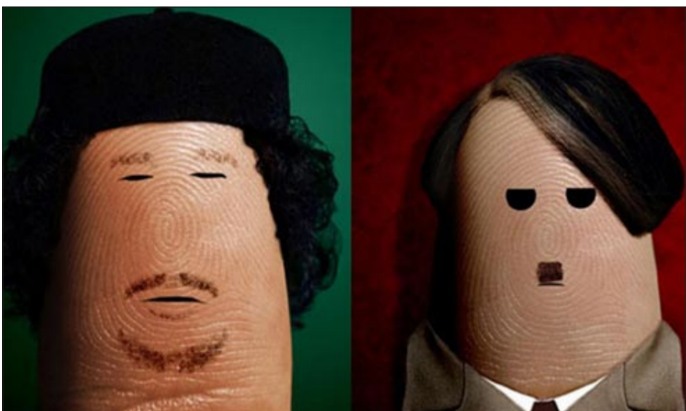
رسم الفنان الإيطالي للقذافي وهتلر على «الإبهام»

أبطال ستار تريك»، وعلى الجانب الآخر يرسم الطفلة أمثال: «القذافي، هتلر وأخيرا القاتل المتسلسل واكل لحوم البشر هاننيبال. وقال «فون» في مقابلة مع الجريدة: «بدأت القصة معي منذ 3 سنوات، حيث شاهدت فيلم أفاتار وأرادت رسمه، ووضع الصورة على الـ «الفيس بوك» لأزليها لأصدقائي، وحينها لم يكن معي ورقة فرسمنتها على أصبعي واستمرت بفعل ذلك أكثر وأكثر حتى أصبحت محترفا في ذلك المجال».