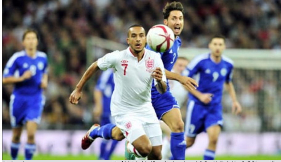
والكوت تالقي في المباراة المهمة امام سان مارينو وقاد إنجلترا لفوز كبير

لاخر اخبار الرياضة المحلية والعالمية زوروا موقعنا على www.alanba.com.kw/Sport