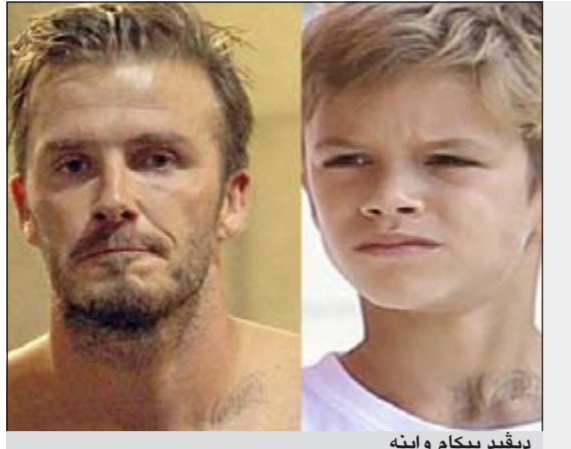
ديفيد بيكام وابنه