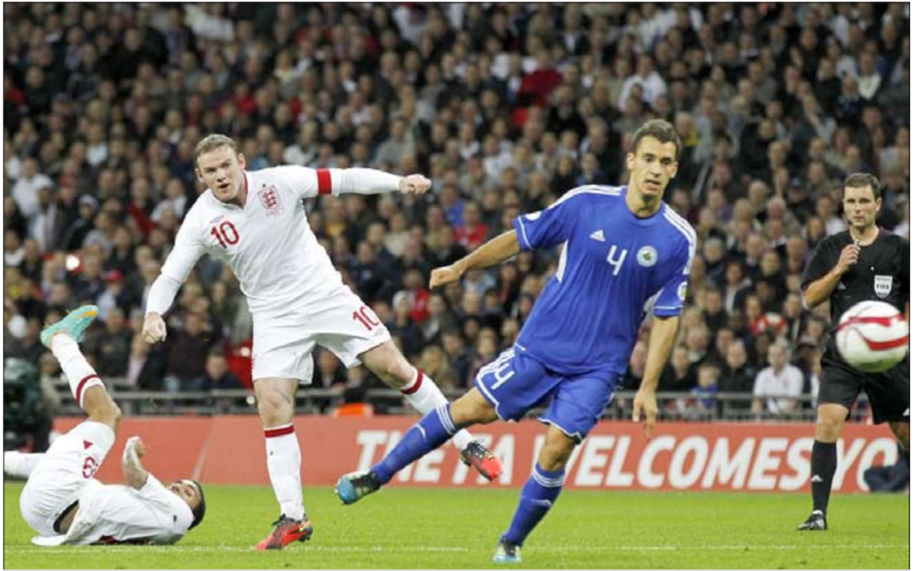
واين روني قاد إنجلترا لسحق سان مارينو