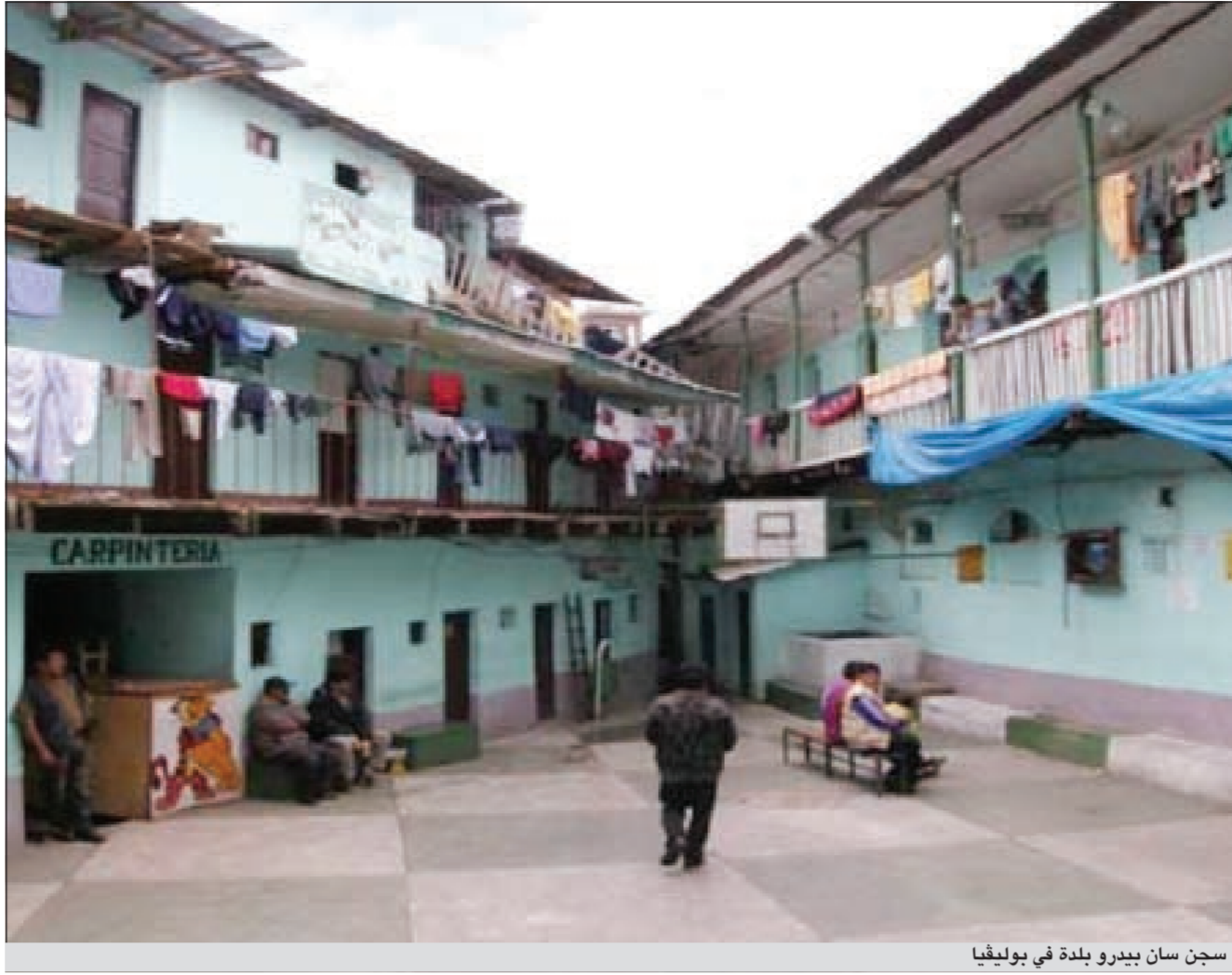
سجن سان بيدرو بلدة في بوليفيا