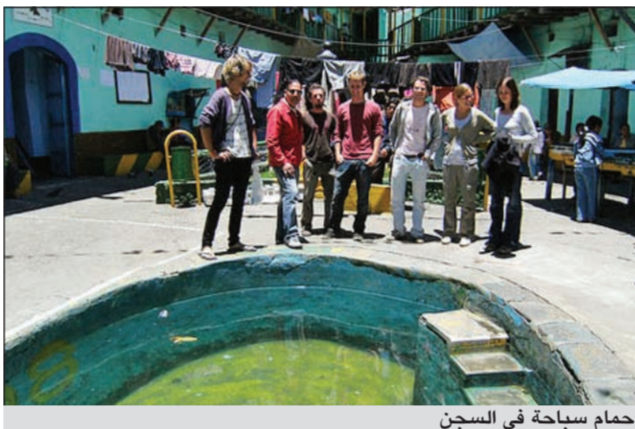
حمام سباحة في السجن

سجن سان بيدرو هو أكبر سجن في لايباز، بوليفيا، يضم حوالي 1500 سجينًا، وخلفًا عن غيره من السجون عبر العالم، فإن