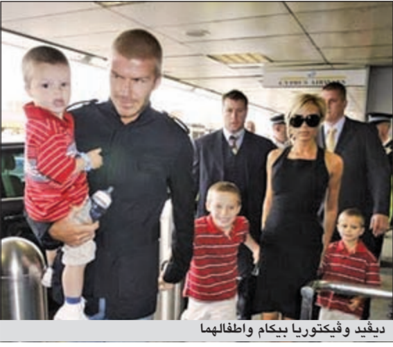
ديفيد وفكتوريا بيكام واطفالهما